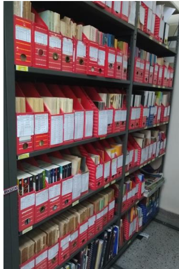
Por nombre de Institución