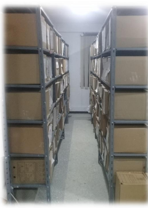
Archivo Central Batallón "Rifles" . (02/11/2017) fotografía tomada por : Yulieth Baza