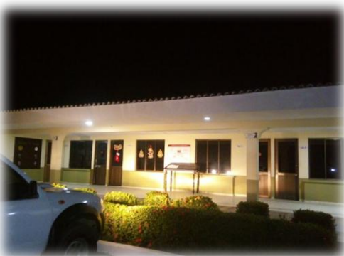
Comando del Batallón "Rifles" . (20/10/2017)