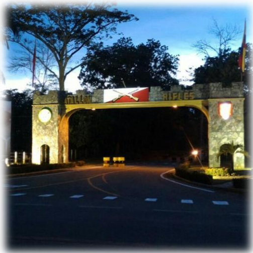
Entrada del Batallón "Rifles" . (20/10/2017)