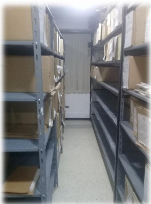
Archivo Central Batallón "Rifles" . (02/11/2017)

Anexo # 1, fondo acumulado del Archivo Central del Batallón de Infantería Aerotransportado N° 31 "Rifles"