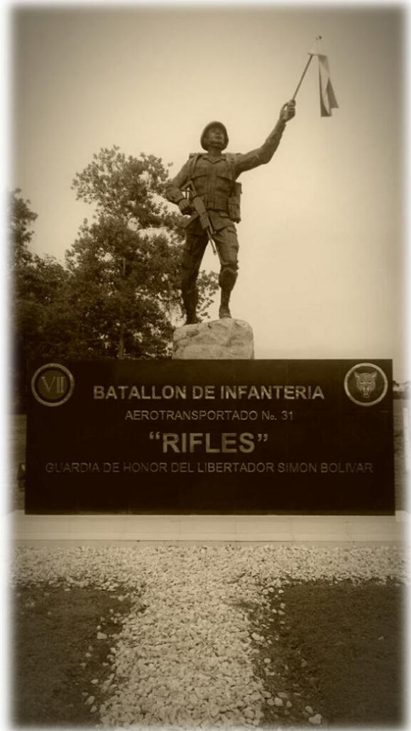
Monumento Guardia de honor del Batallón "Rifles" . (20/10/2017)