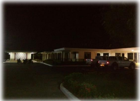
Comando del Batallón "Rifles" . (20/10/2017)