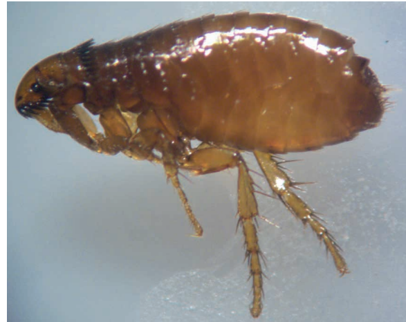
Figura 6. Ctenocephalides felis adulto. Detalle de ctenidios genales 1 y 2, y setas de la tibia posterior.

Los tratamientos químicos contra ectoparásitos se han realizado por más de 50 años, con ventajas rela-