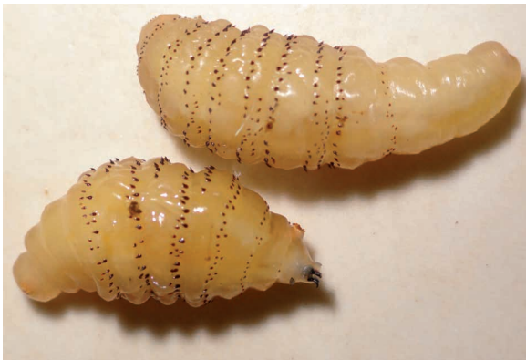
Figura 5. Larva 3 de Dermatobia hominis . Detalle de ganchos bucales, estigmas anteriores y espinas.

En la naturaleza se encuentra gran diversidad de moscas que actúan directamente como ectoparásitos causando miasis externas, subcutáneas, internas o sistémicas y cavitarias, siendo frecuente encontrar en Colombia y otros países de América Latina las especies Dermatobia hominis (figura 5), 13 Cuterebra sp., Cochliomyia hominivorax , 14 Gasterophilus sp., y Oestrus ovis , parasitando bovinos, ovinos y caprinos, équidos, perros, ardillas, el humano, y otros hospederos; 12 durante el período que transcurre desde el estadio de huevo o larva 1 hasta larva 3. 15