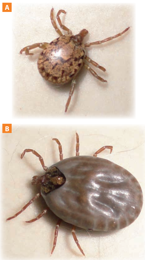
Figura 2. A. Amblyomma sp. macho. B. Hembra.

Dentro de los dípteros, las moscas picadoras de la familia Tabanidae, y las especies Stomoxys calcitrans y Haematobia irritans , y algunos mosquitos como Culex , Aedes , Mansonia , Psorophora , Haemagogus , Sabethes , Deinocerites , Anopheles y Culiseta melanura son los insectos