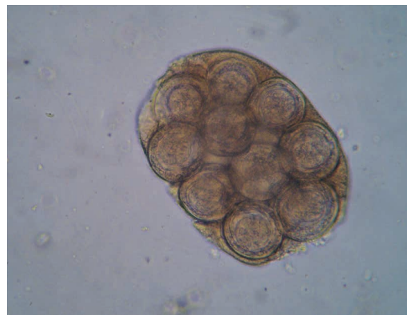
Figura 7. Cápsula ovígera de Dipylidium caninum . Aumento 1000X.

cionadas con la economía y facilidad de aplicación; sin embargo, la utilización intensiva de estos productos ha llevado a la resistencia de los artrópodos y a la contaminación ambiental y de productos alimenticios de origen animal que repercuten sobre la salud humana. Es necesario, implementar estrategias sostenibles basadas en el control integral y racional que permitan la adquisición de inmunidad en el animal por efecto de exposición constante y gradual al vector y el microorganismo; y que reduzcan el impacto negativo que se genera sobre la salud y el bienestar animal, y sobre el ambiente y la población humana. 2