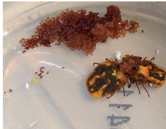
Figura 1. Hembras de Rhipicephalus (Boophilus) microplus realizando la oviposición.

representan el grupo de garrapatas más importante como ectoparásitos de animales. 4 Los géneros y/o especies Rhipicephalus (Boophilus) microplus (bovino) (figura 1), Rhipicephalus sanguineus (perro), Dermacentor sp.,