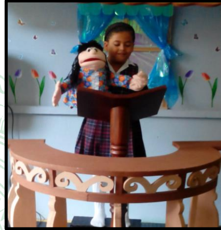
Representación con títeres.