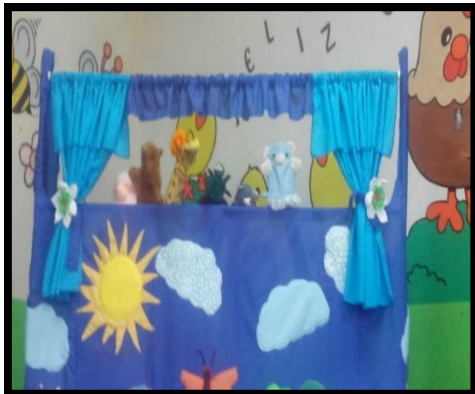
Obra de títeres