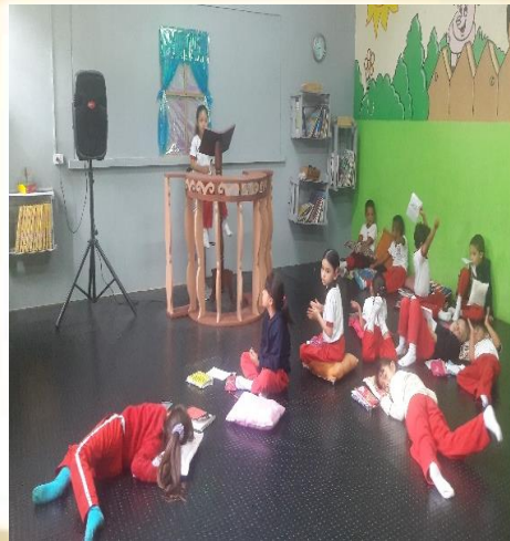
Imagen 1: Actividad de lectura en voz alta.

“... el mundo está lleno de niños que necesitan aprender la lectura...”