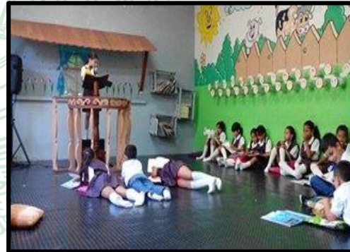
Lectura en voz alta