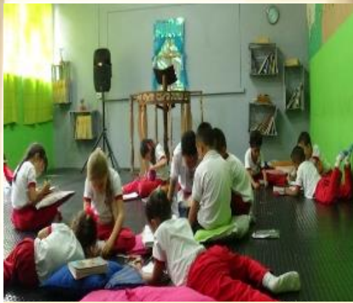
Imagen 4: lectura individual de textos cortos.

“...Es un lugar donde aprendemos a leer y leemos frases, diferentes tipos de lectura práctica, lectura para cuando seamos grandes ser buenos leyendo...”