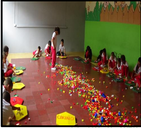
Construcción del balcón de la lectura, reconstrucción de su nuevo espacio.