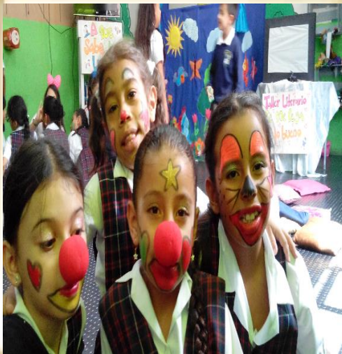
Imagen 5: Presentación teatral “¿A qué sabe la luna?”

“...El balcón es como un huevito y allá jugamos a ser cantantes y también bailamos y ahí nos enseñan a leer...”