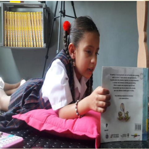
Imagen 2: Lectura de texto libre.

“... Los niños aprenden a leer con libros, primero cogemos el cojín y cogemos un libro, cualquier libro...”