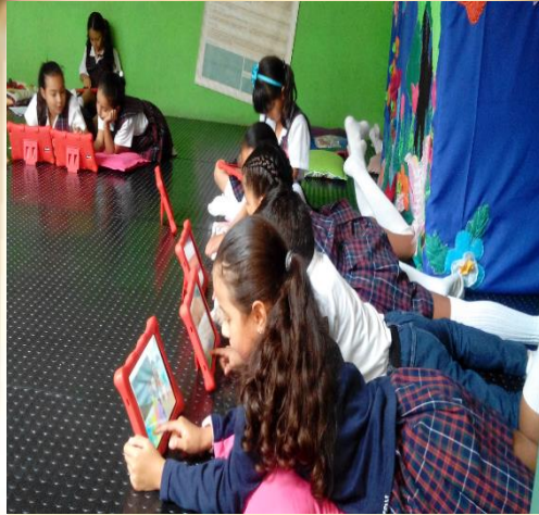
Imagen 3: Lectura de cuentos “Leer es mi cuento” a través de tabletas.

“... Cuando hicimos el balcón me encantó los libros tiene muchas cosas, yo leo libros súper buenos, me encanta el teatrino y los títeres...”