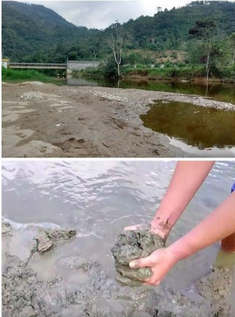
Imagen 4 -Imagen arriba: Sedimentación antes de la captación del río Cocorná, imagen abajo sedimentación antes de la captación del Río Nare en Alejandría Antioquia.

Otro de los impactos provocados con la construcción de una PCH es la reducción del caudal del río desde un 75% aproximadamente hasta en un 90% en épocas de sequía, esto se debe a que el agua es captada por unos canales y tuberías para luego ser conducida hasta unas turbinas que con la fuerza hídrica permite la generación de energía. El caudal restante ósea ese 25% o 10% es el que solamente dejarían fluir libremente, el cual se denomina caudal ecológico, afectando enormemente el ecosistema de la cuenca, ya que tanto la fauna y la flora existente de estos lugares se ven directamente amenazados por este tipo de proyectos.