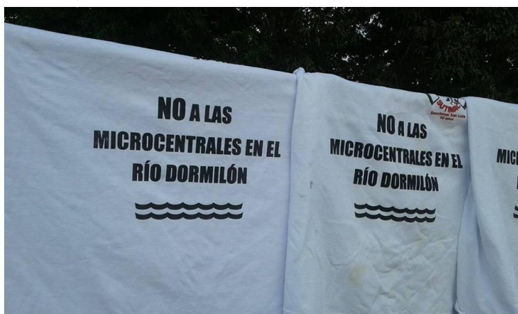
Imagen 1 - Estampación de camisetas como actividad programada