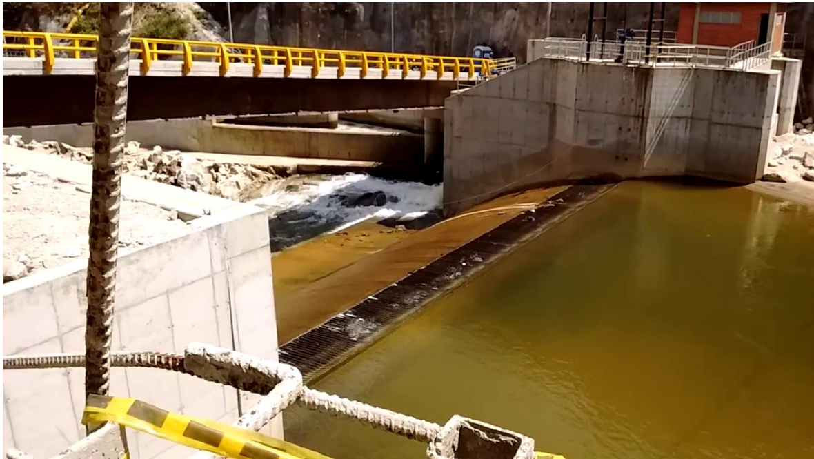
Imagen 5 - En Alejandría Antioquia se observa cómo es la captación de una microcentral a filo de agua sobre el y el caudal ecológico que dejan libre.

En la construcción de las PCH, se realizan excavaciones de túneles muy profundos, los cuales cuando no se diseñan bien, generan fuertes impactos negativos como la pérdida o disminución de aguas superficiales, de las cuales se abastecen campesinos y animales que dependen de este líquido vital (Agudelo, 2017), esto lo logramos evidenciar en el municipio de Cocorná en la vereda el Popal en donde se construyó una microcentral a filo de agua, ocasionando la pérdida de las aguas superficiales de esta vereda y a su vez de algunos arroyos de los cuales varias familias se abastecían para satisfacer las necesidades básicas de sus hogares.