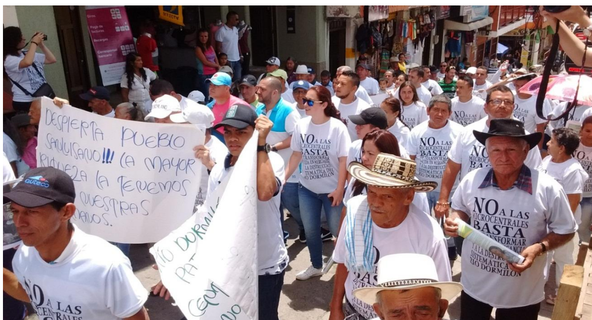
Imagen 2 - Marcha de protesta por la calles del municipio de San Luis

En este sentido, el movimiento para la protección del río Dormilón surgido en el municipio de San Luis, Antioquia, para construir esa base argumentativa que sostenga la apuesta social del movimiento, revive los tiempos en que los habitantes del municipio pasaban sus tardes en el río disfrutando de sus cristalinas aguas. Allí ellos partir de las relaciones sociales que se han tejido alrededor del río han construido parte de su identidad e hicieron al Dormilón como parte de su familia, de su familia Sanluisana. El río sigue siendo ese espacio de encuentro familiar y comunitario para los habitantes del municipio, lugar donde se han tejido fuertes relaciones sociales logrando construir una identidad colectiva de pertenencia a estos