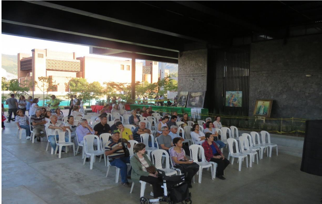
Imagen 7 Cultura Parque. Tomado de archivo de la JAC Conquistadores. 2019

improcedente, ya que este tiene la ventaja de que la gente fue a disfrutar, distraerse, a celebrar algo, entonces la realización de actividades se suma a sus planes.