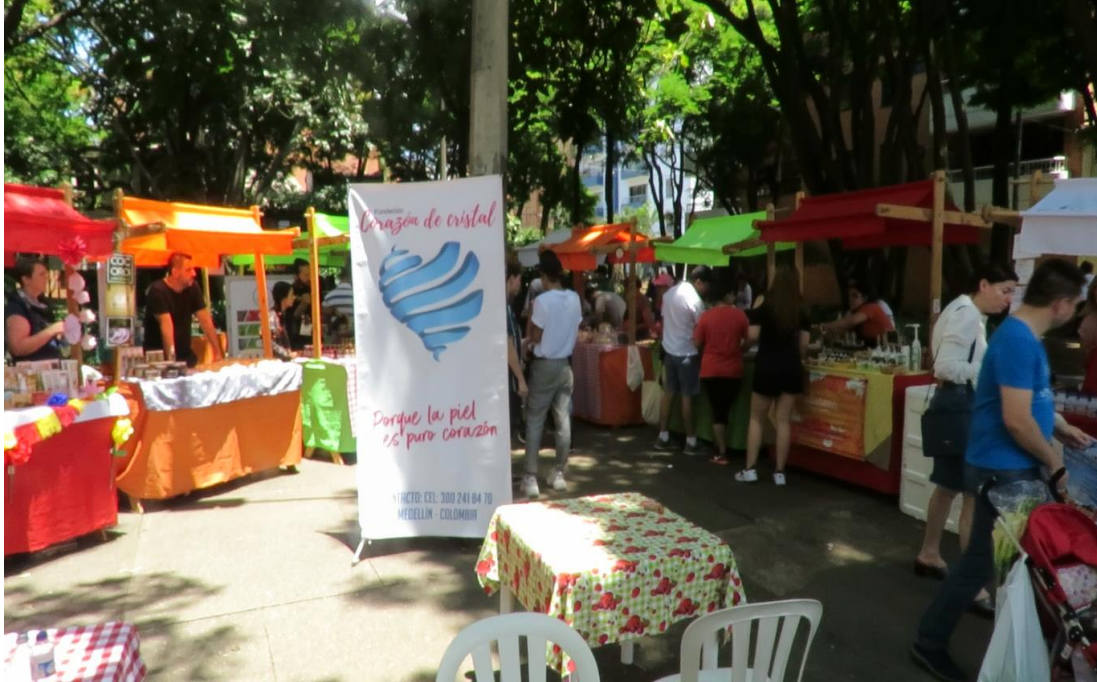
Imagen 1 Festival de la alimentación saludable y sostenible. Tomado de archivo de la JAC Conquistadores. 2019

Si bien, la asistencia de los residentes al evento se puede considerar abundante, se da más como un mercado de paso. Hay bastantes personas, de todas las edades, interesadas en los productos agroecológicos, sin embargo, cuando los adquieren se ausentan del lugar. Sólo un pequeño grupo de personas permanece, se sientan en las sillas a gozar de las actividades de la jornada e inician conversaciones desde lo que están disfrutando, la mayoría de ellos son adultos/adultos mayores, que se dejan cautivar por la “música de mi tierra”.