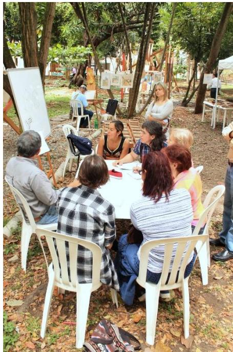
Imagen 3Conquistarte. Tomado de archivo de la JAC Conquistadores. 2019

organización de la JAC. Juntos atrapan a los participantes con la fusión de arte, comunidad sostenible y cohesión social; por eso, es de resaltar la manera en que, desde el arte, se concientiza a cerca del cuidado del medio ambiente, y se promueve la participación de personas de todas las edades.