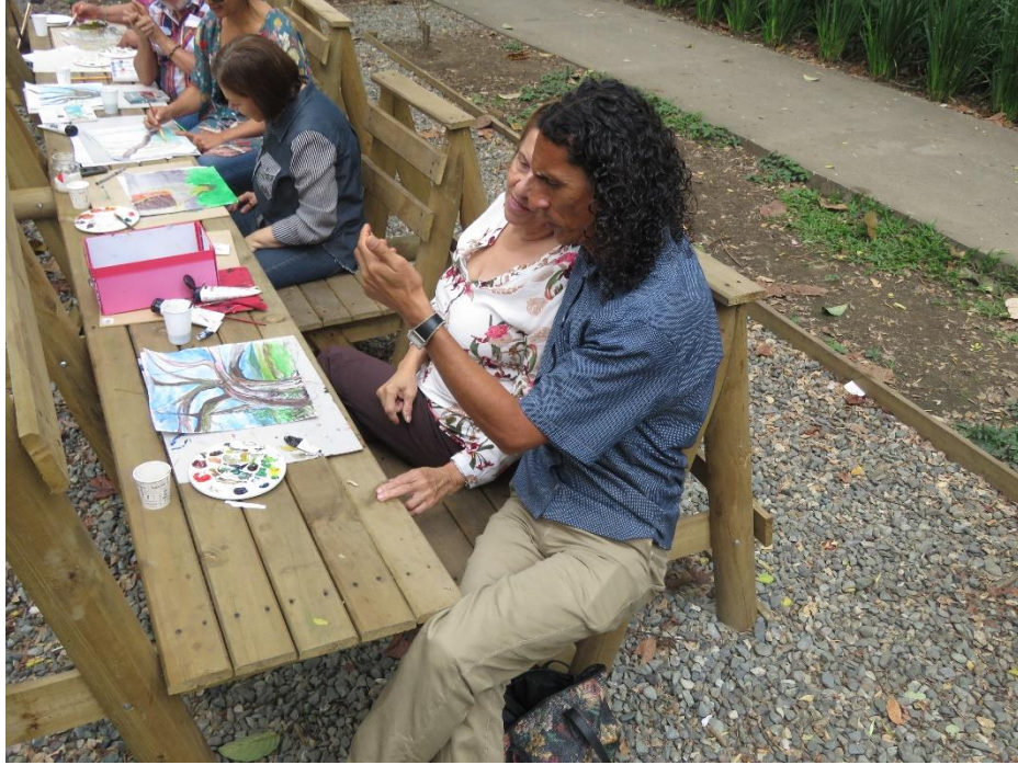
Imagen 4Conquistarte. Tomado de archivo de la JAC Conquistadores. 2019

Se observa, además, que el lugar tiene un significado de lucha para los artistas, porque se ha recuperado y apropiado para el arte, buscando transformar el lugar en un taller al aire libre, además de que es una oportunidad para que las personas participen y se vinculen con este tipo de eventos. Aunque desde el colectivo realizan actividades enfocadas a niños, jóvenes y adultos, la participación de los residentes del barrio, aún más de los vecinos del parque, es escasa. La gente no va al evento. En su momento quedaron muchas dudas, sobre si es por el día (Se realiza el segundo sábado de cada mes), por el tipo de evento, por la población residente o ¿por qué?