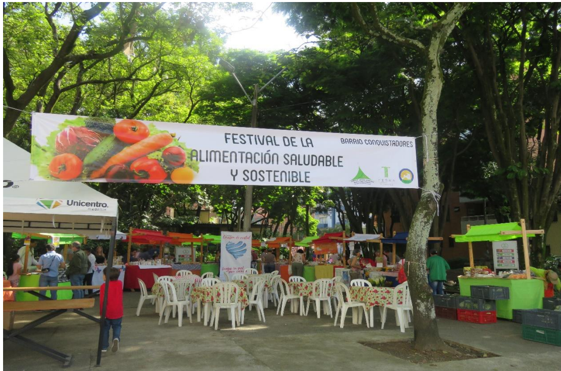
Imagen 2 Festival de la alimentación saludable y sostenible. Tomado de archivo de la JAC Conquistadores. 2019

Aunque algunas de las personas que asisten al evento, son constantes y están atentas a las fechas en que se realiza, manifestaban en conversaciones espontáneas que la convocatoria y promoción de los eventos se debe mejorar, dado que la mayoría de las veces no se enteraban del día o de las actividades que la Junta realizaba. Adicional a esto, las observaciones permitieron llegar a la idea de que es importante desarrollar actividades que sean más llamativas para la juventud, ya que de esa manera pueden cautivar a nuevas generaciones a que participen de la jornada y no sólo del consumo.