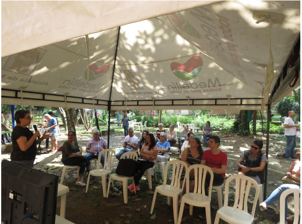
Imagen 5 Conquistarte. 2019

Es desalentador cuando un montón de personas se esfuerzan por aumentar la participación, por promover la apropiación del espacio público o simplemente por la idea de que alguien vaya, se distraiga un ratico desde la expresión del arte, se tome un tinto y aprenda algo. Definitivamente, esta experiencia me hizo que reafirmara mi posición de acuerdo a la metáfora de que la apatía es una “ enfermedad ”.