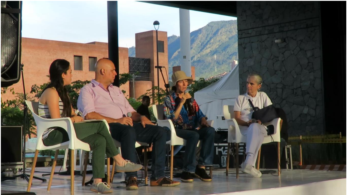
Imagen 6 Cultura Parque. Tomado de archivo de la JAC Conquistadores. 2019

Mis expectativas con este evento eran altas; por un lado, el eco que generó la noticia sobre la construcción de una mega obra como Parques del Río, en la ciudad de Medellín, fue tema nacional e internacional, por lo que quería visualizar y sentir ese eco desde la cercanía; por el otro, estuve enterada de que residentes del barrio Conquistadores, realizaron plantones, y demás expresiones de lucha en contra de la construcción de ese proyecto, por tanto tenía curiosidad por la manera en la que habían llegado a acuerdos (si los hubo) con la comunidad, más con la JAC que realizaba su evento en ese lugar.