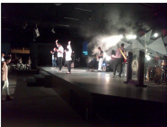
Figura 10. Es un culto dominical de la Comunidad Cristiana de Fe en horas de la mañana, en ésta escena los integrantes junto con el líder de alabanza alzan sus manos como señal de adoración a Dios e incitan a las personas asistentes a tener la misma actitud mientras suena una canción más lenta.

Autor: Arled Stella Álvarez Vélez. (2013).