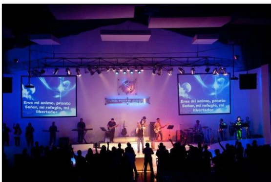
Figura 9. Centro Cristiano Laureles A.I.M.C.O. Extraída el 26 de Febrero de 2015 de https://www.facebook.com/centrocristianolaureles

Autor: Arled Stella Álvarez Vélez. (2014).