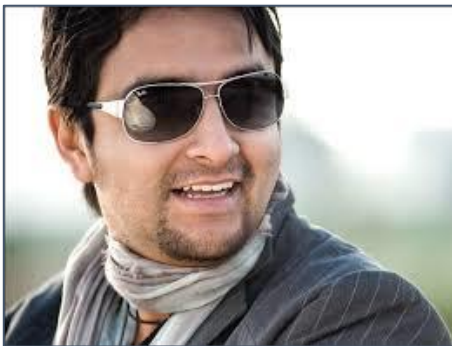
Figura 11. Alex Campos. Músico, Compositor y Cantante Colombiano de música cristiana, ganador de dos Premios Grammy Latinos por mejor álbum cristiano en español.

En Colombia se dieron varios grupos, pero no sobresalientes a nivel nacional, luego surgieron grupos de alabanza como Generación Doce, de la Iglesia Misión Carismática Internacional, grupos como Pescao Vivo, y solistas como Alex Campos, (Figura 11), que lograron un reconocimiento nacional e internacional considerable.