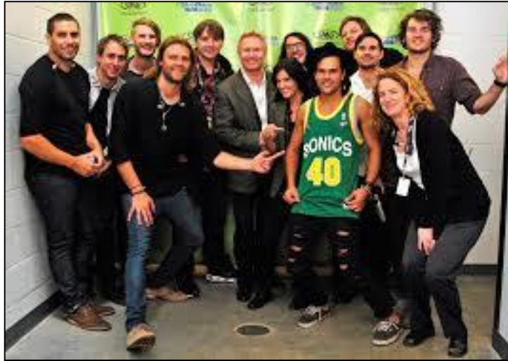
Figura 5. Hillsong United. Agrupación Surgida de la Iglesia Hillsong, en Australia. (Extraído el 18 de Septiembre:

https://www.google.com.co/search?q=hillsong&biw=1093&bih=498&source=lnms&tbm=isch&sa=X&ei=UIUhVN2IHNaQgwTv04DYAQ&ved=0CAYQ_AUoAQ#facrc=_&imgdii=_&imgrc=Nq7DjhFChTdgVM%253A%3BTk7f1GkiWUSg1M%3Bhttp%253A%252F%252Fa0.aastatic.com%252Fassets%252Fimg%252Fcontent%252Findustry-snaps%252Fchristian%252F2011%252F747xH%252Fhillsong-seattle.jpg%3Bhttp%253A%252F%252Fwww.allaccess.com%252Fchristian%252Findustry-snap%252Fq%252Fid%252F2817%3B747%3B527 )