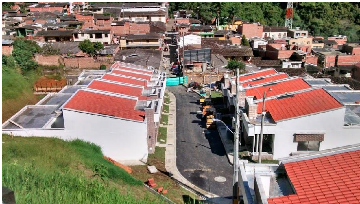
Figura 3: Foto, Urbanización jardines de San Andrés.

La presión sobre la vivienda no sólo se debió a la población foránea. Para la adecuación de las carreteras fue necesario la compra de vivienda de algunos de los locales, a éstos se les ofrecieron tres opciones: quedarse en el pueblo y comprarles otra casa, esperar la urbanización (ver foto) o ser reubicados en otra parte. El grupo de familias que decidió esperar en el pueblo mientras era construida la urbanización tuvo que ser reubicada temporalmente en otras casas bajo la movilidad de arriendo, constituyéndose como otro elemento que afectaría la demanda y precio de la vivienda en el pueblo.