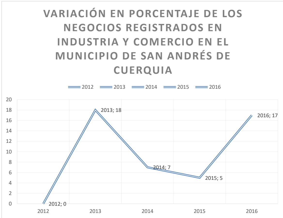
Figura 5: Gráfico 2, Variación en porcentaje de los negocios registrados en Industria y Comercio en el municipio de San Andrés de Cuerquia.

San Andrés desde el año 2012 hasta el 2016. En él se puede observar el importante crecimiento que tuvo en el pueblo el comercio en especial en entre el año 2012 y 2013.