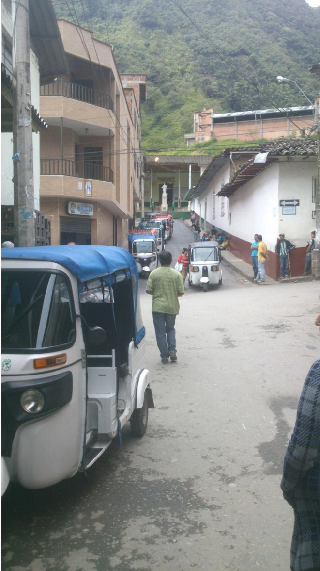
Figura 2: Foto, acopio de “motoratones” en el pueblo.

cantidad de personas que podían alojar y así conseguir más dinero; antes de H.I. solo había dos hoteles.