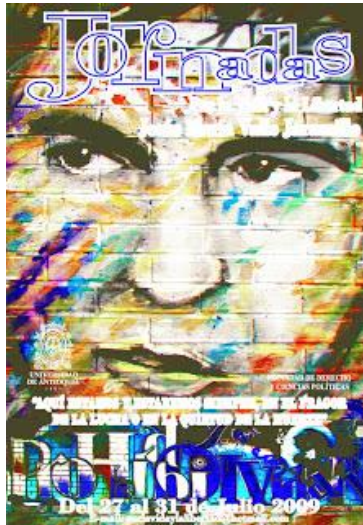
Imagen y texto tomados de http://www.ipc.org.co/agenciadeprensa/index.php/2009/02/26/reflexion-y-homenaje-puntos-centrales-en-jornadas-jesus-maria-valle/

artículos 7.1, 5.1 y 4.1 de la Convención Americana de Derechos Humanos, en relación con las garantías de seguridad que debió brindarse en su momento al inmolado defensor de derechos humanos.