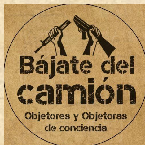
Ilustración 20. Flyer del colectivo bájate del camión

Los participantes del grupo Semillas del Futuro , al estar inmersos en contextos permeados por la conflictividad, comenzaron a implementar estrategias que tienen como objetivo el rechazo y la denuncia por la violencia. De esta manera decidieron articularse con diversos colectivos de la ciudad que trabajan a partir de la objeción de conciencia.