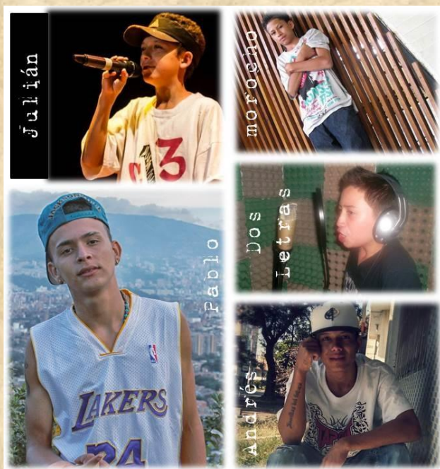
Ilustración 12: Las primeras Semillas

Es así como AKA nos comienza a relatar el surgimiento del grupo Semillas del Futuro , el cual se conformó desde el 2009 como una iniciativa para unir lo artístico con el agro.