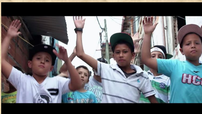
Ilustración 15. Participantes de la canción La Casa Oscura

La canción: La Casa Oscura 17 , que representa la primera canción del grupo, se creó de manera colectiva y participaron en la composición y grabación los integrantes de semillas: