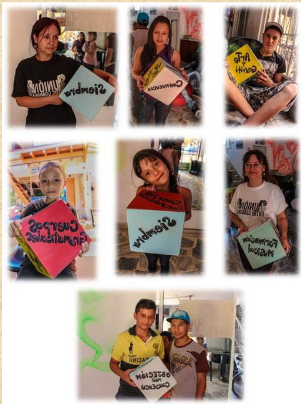
Ilustración 5. El Cubo

Responde el compañero de la derecha y vuelve a tirar.