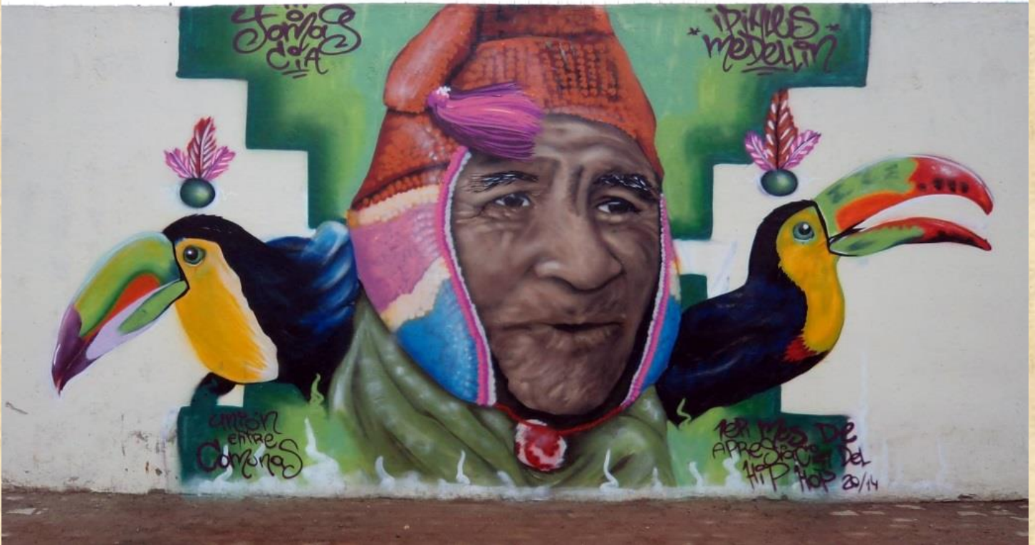
Ilustración 14. Ipiales 2015