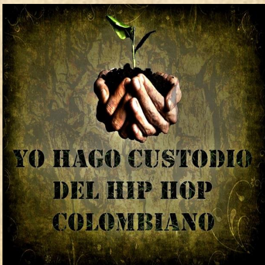
Ilustración 16. Flyer Yo hago custodio del Hip Hop Colombiano. 11 de Octubre de 2013

Así mismo, se realizó el Yo Custodio del Hip Hop Colombiano , un evento musical abierto a la comunidad que se viene realizando cada años desde el 2013, y en el cual se hace el