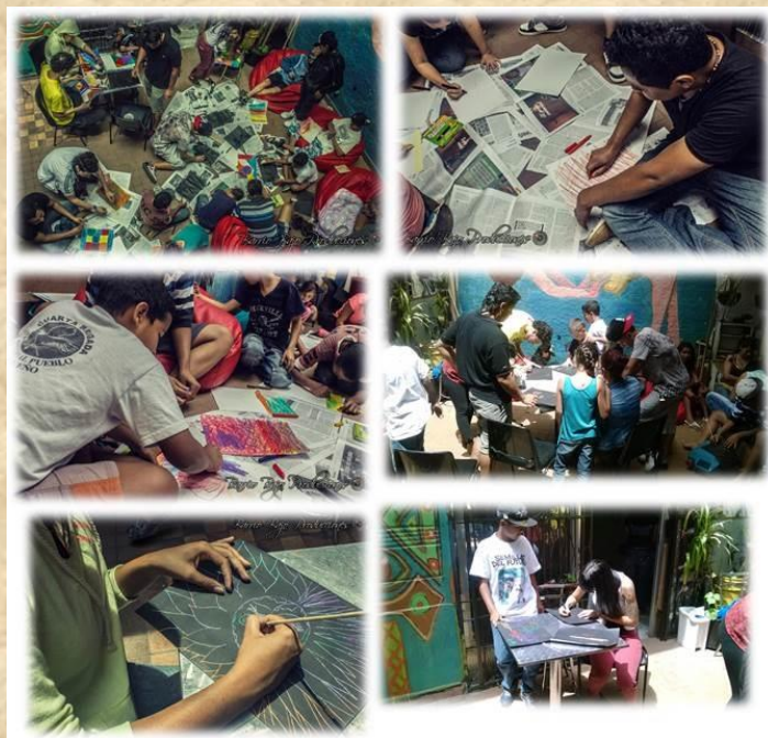
Ilustración 4. Juiciografía

El cubo: esta técnica permitió abordar las diferentes estrategias educativas presentes en el proceso de Semillas del Futuro y para su elaboración, se tuvieron en cuenta seis escenarios educativos que habían surgido de las técnicas aplicadas anteriormente. El propósito de esta técnica era analizar la influencia de las acciones educativas del grupo Semillas del Futuro en la configuración de sujetos políticos.