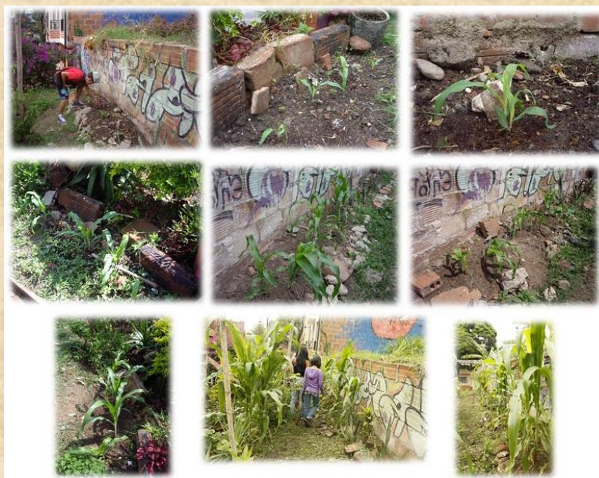
Ilustración 1. La chocolera

Los materiales utilizados para el desarrollo de esta tēcnic fueron: Semillas de maíz, recatones, tabla de madera, pintura, regaderas y piedras.