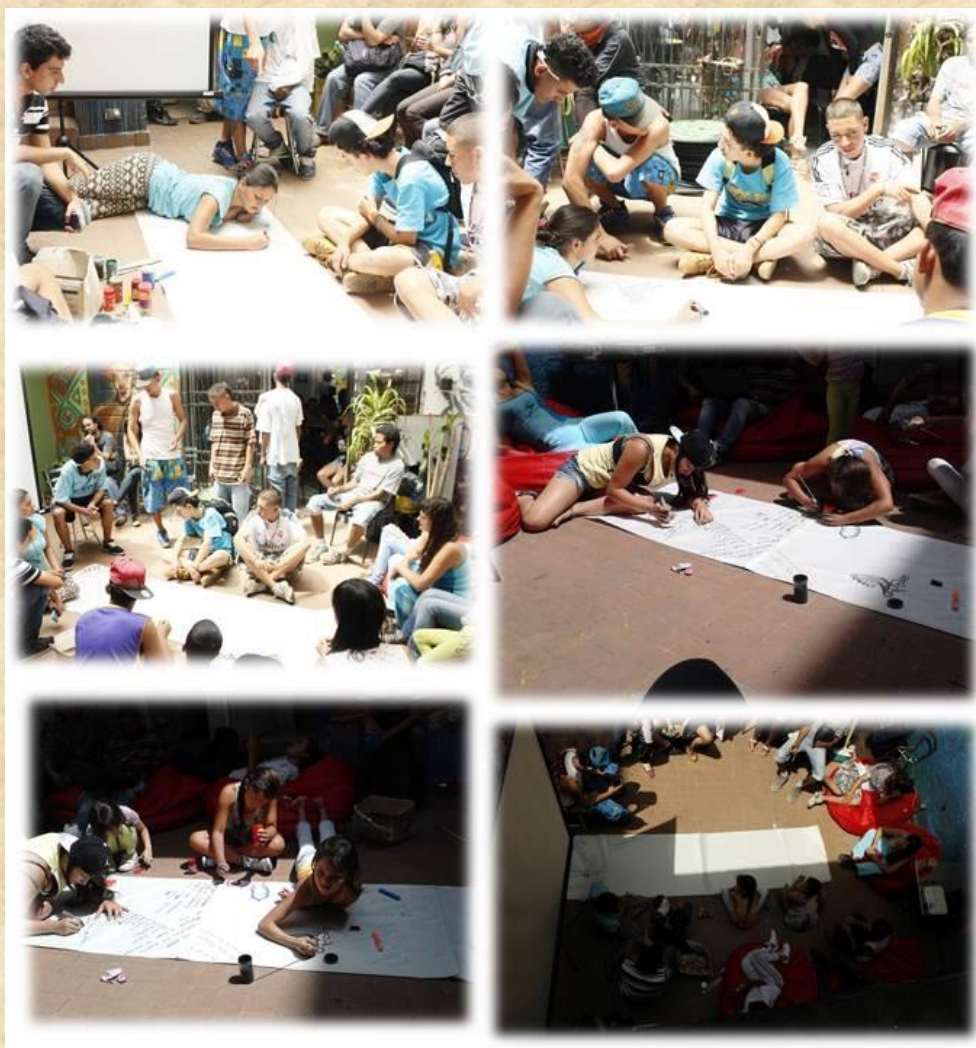
Ilustración 2. Línea de memoria

Papelógrafo: esta técnica emergente dentro de la planeación metodológica, surgió por la necesidad de aclarar algunos asuntos organizativos del grupo, tales como: participantes del proceso, permanencia dentro del proceso, participación en otros espacios de unión entre comunas, acompañantes del proceso, acciones realizadas y propósitos de estas y aprendizajes adquiridos.