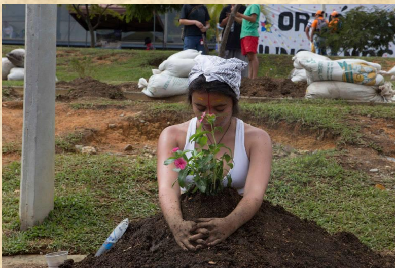
Ilustración 17. Cuerpos Gramaticales. 16 de Octubre de 2014

“Cementerio, en un país donde duermen historias, una ciudad que ha perdido sus memorias, una comuna que habla siembra, un barrio entero a la vida se aferra. Una cuadra, una casa, una familia entera, un hijo recuerda.” 20