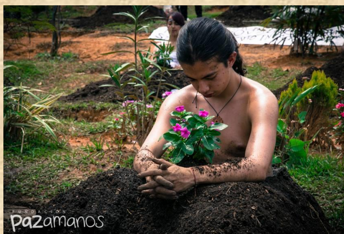
Ilustración 18. Cuerpos Gramaticales. 16 de Octubre de 2014

Durante la primera versión de “Cuerpos Gramaticales”, se lograron sembrar 100 cuerpos durante 6 horas los cuales durante ese tiempo hicieron catarsis colectiva como una forma de curarse y curar, bajo la intensión de hablar de los desaparecidos del país de sus pérdidas y dolores en especial de la comuna 13, para que la población no olvide los cuerpos desaparecidos que se encuentran en la escombrera y en los morros del corregimiento de San Cristóbal y la vereda la Loma. Resultado de la operación Orión y las otras operaciones –otoño, contrafuego, mariscal, potestad, antorcha y demás- que tuvieron lugar en Medellín, específicamente en la comuna 13, dejando heridas abiertas en la población; porque, además, las operaciones Mariscal y Orión fueron acciones sin antecedentes en las ciudades colombianas y causaron un gran impacto en la población por el número de tropas armadas que participaron y el tipo de armamento utilizado, así mismo por las acciones contra la población civil (asesinatos, detenciones arbitrarias, ataques indiscriminados y desapariciones) (Agroarte, 2015).