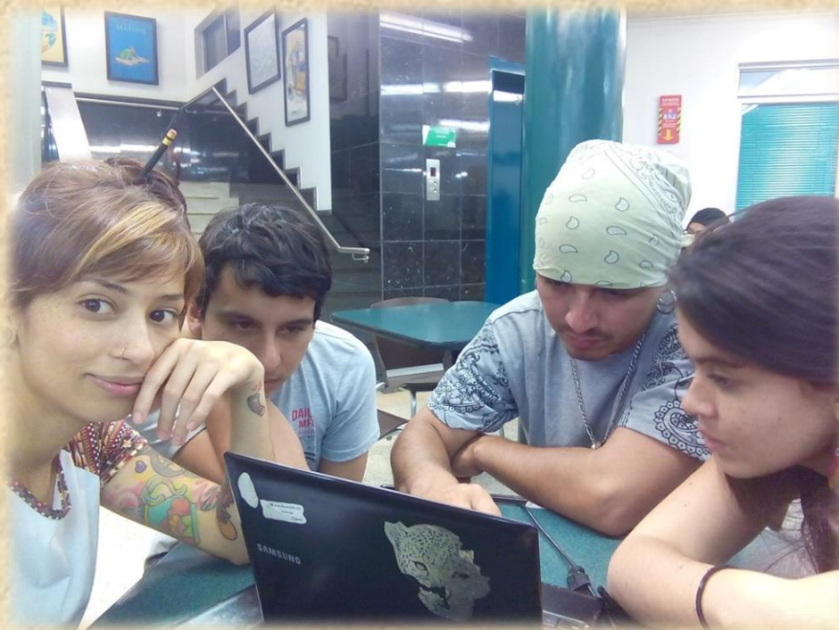
Ilustración 7. Triangulación de Información.

Para el abordaje de esta técnica nos reunimos con el equipo de apoyo de la investigación, conformado anteriormente, con el propósito de triangular la información recolectada durante el proceso y proceder así a la construcción de las matrices de análisis.