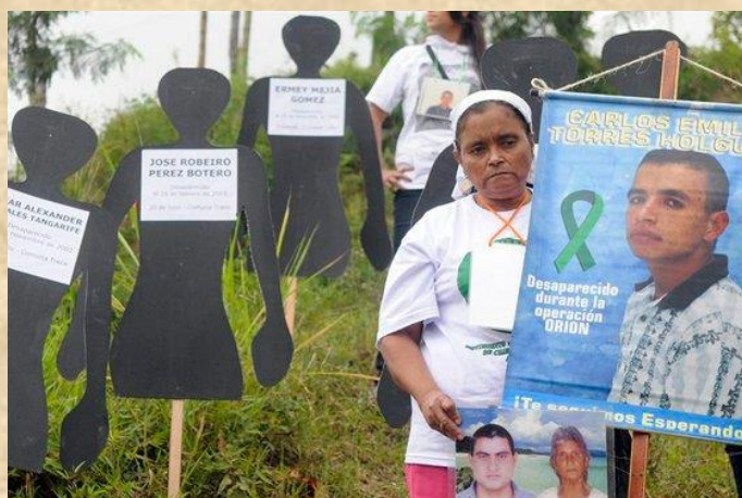
Ilustración 10. Los rostros de la escombrera.

Ante la incertidumbre de las familias por desconocer el paradero de sus víctimas, se han hecho varios derechos de petición al Tribunal Superior de Medellín y a la Sala de Justicia y Paz, con el propósito cerrar la Escombrera y poder así comenzar las labores de búsqueda. Estas peticiones fueron atendidas por estos organismos gubernamentales que presionaron al alcalde Anibal Gaviria para dar solución a esta situación; sin embargo y por falta de voluntad política la Alcaldía de Medellín ha hecho caso omiso.