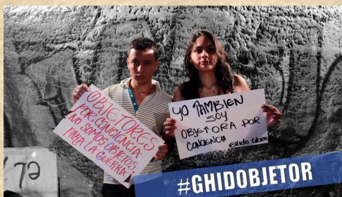
Ilustración 21. Acción Colectiva contra el reclutamiento de Ghido.

falta de servicio y gracias a la presión y resistencia yo digo que se logró salir en cuatro meses (Ghido, 2015).