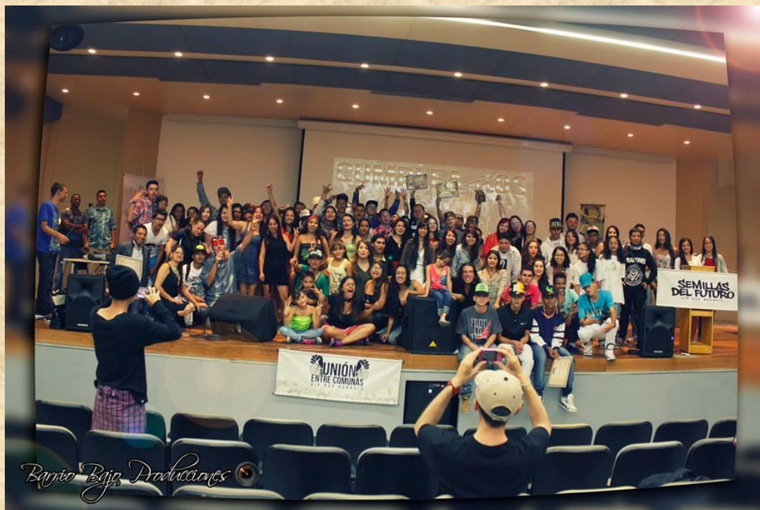
Ilustración 11. Fotografía Graduación Agroarte- Unión Entre Comunas