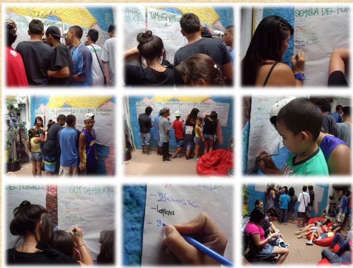
Ilustración 3. Papelógrafo

hacemos y qué hemos aprendido, y se les entregaron varios marcadores para que cada uno respondiera. Al finalizar se socializaron las respuestas y a la vez se complementaron.