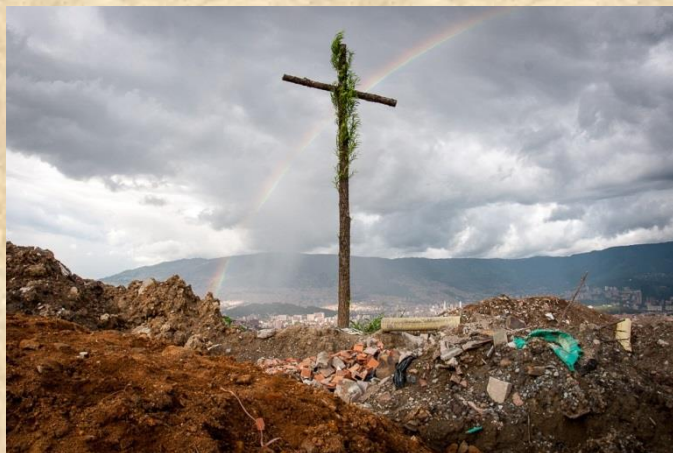
Ilustración 19. La “Escombrera” de la 13: 13 años de clamor por la verdad

Es por lo anterior, que Cuerpos Gramaticales es un acto conmemorativo y reflexivo frente a la memoria, la lucha y la resistencia, que simboliza a su vez el cuerpo de la historia Colombiana, que lleva consigo el peso de las masacres, el destierro, los asesinatos, las mutilaciones, el despojo y la impunidad.