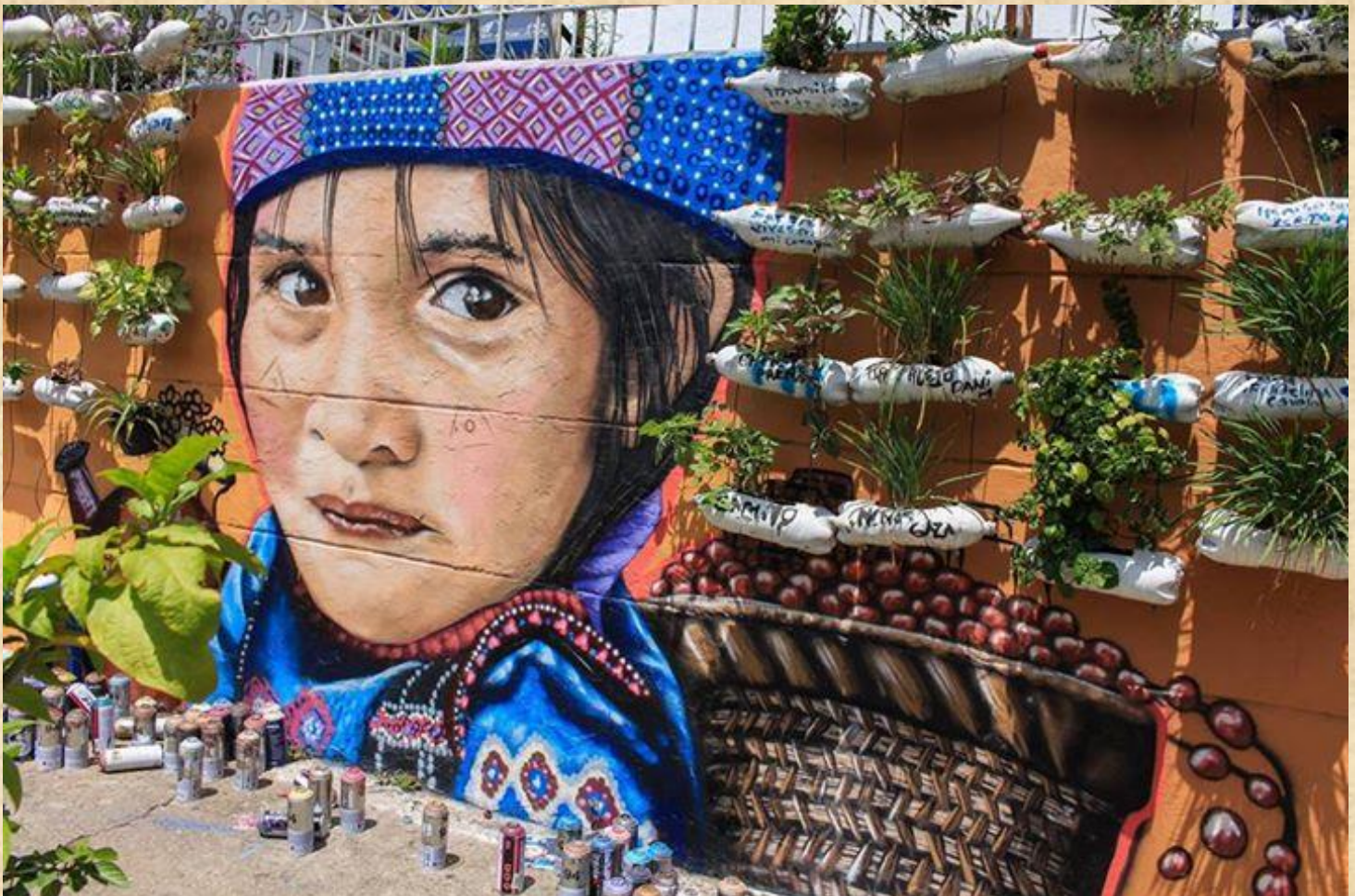
Ilustración 13. Memoria y Resistencia. Operación Mariscal no olvidar