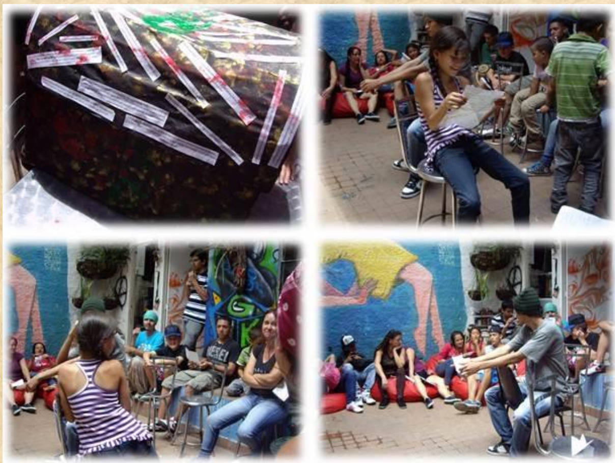
Ilustración 6. Tesorarte