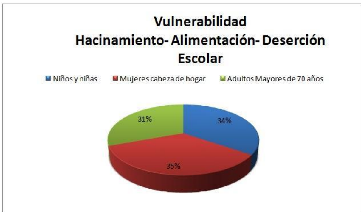
Diagrama N° 1: porcentajes de vulnerabilidad en Medellín.