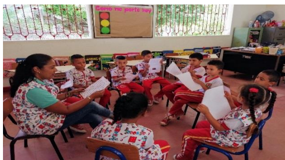
Lectura de cartas elaboradas para los niños