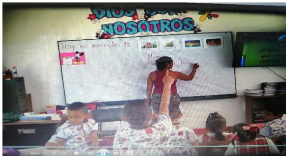
Portador de texto "la carta" (Mayo 29)