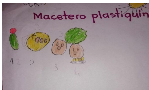
Portador de texto "Instructivo" (julio 17)