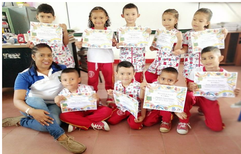
Entrega de certificados a los niños participantes. Noviembre 2019