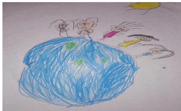
Producción de los niños