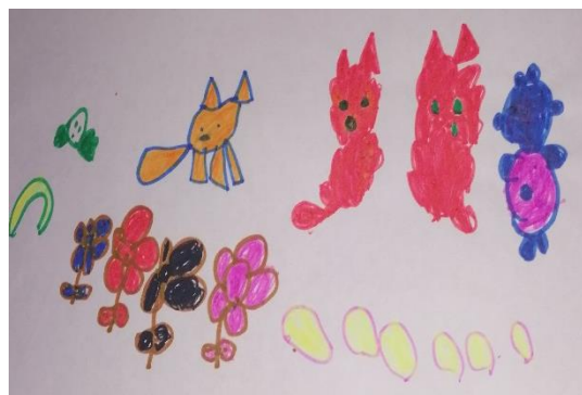
Producción de los niños