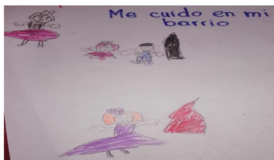
Producción de los niños