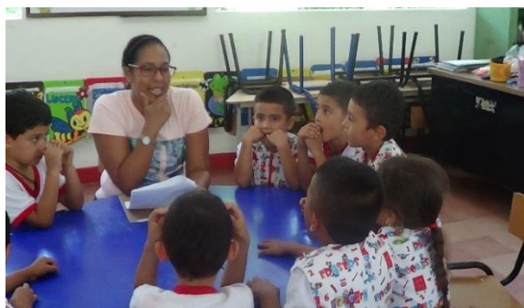
Portador de texto "Dramático" (Mayo 22)