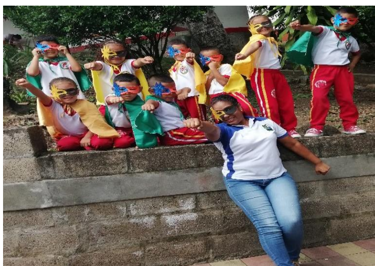
Los héroes del pensamiento. Noviembre 2019