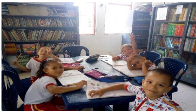
Visita a la biblioteca - acercamiento a los libros