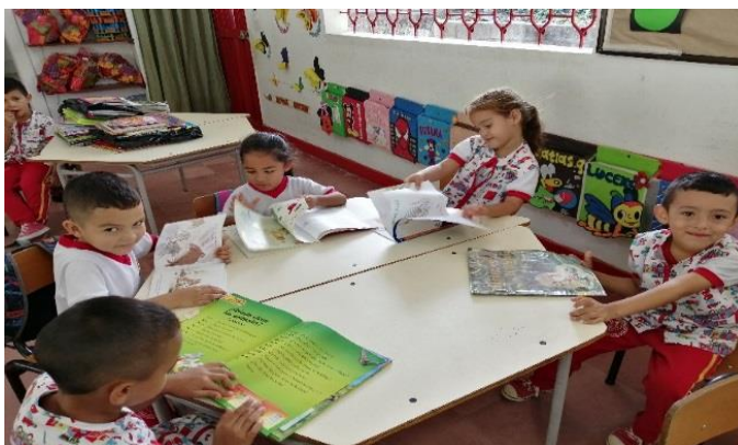
Acercamiento a los libros