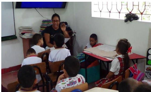
Portador de texto "Canción" (Mayo 8)