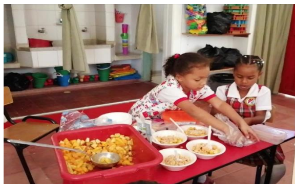
Portador de texto "Instructivo" (Julio 24)