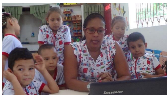
Portador de texto "Historieta" (Mayo 15)