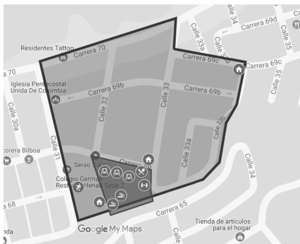
Figura 1: Mapa del Barrio San Antonio, Itagüí. Elaboración propia.

“La Limona” y el corregimiento de San Antonio de Prado, por el oriente con el barrio San Gabriel y al occidente con el barrio Triana. Aunque el barrio usualmente no es reconocido con dicho nombre, sino con el de San Gabriel.