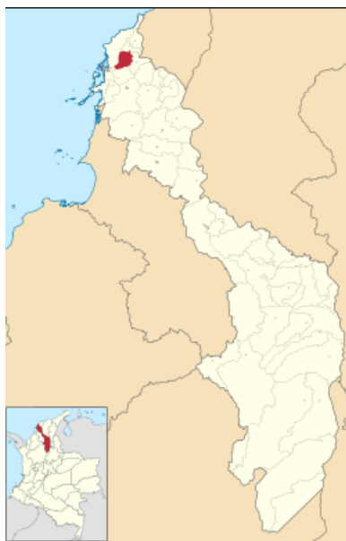
Imagen 1. Mapa del municipio de Santa Rosa, Bolívar

Santa Rosa de Lima o Santa Rosa del Norte, como nombre que se le da al municipio para diferenciarlo del ubicado al sur del departamento de Bolívar, se encuentra a 14 Km de la ciudad de Cartagena de Indias, por lo cual sus actividades cotidianas, incluyendo las económicas, tienen una tendencia a girar en torno a este eje urbano.