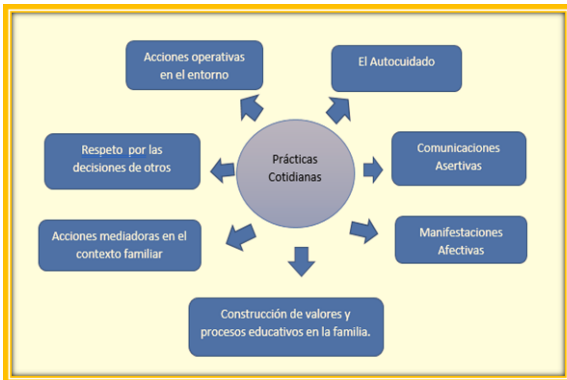
Grafica # 3. Esquema de prácticas significativas. (Elaboración propia).

Las prácticas significativas son aquellas acciones cotidianas que se constituyen en un espacio y tiempo determinado, en interacción con otros de manera rutinaria y repetitiva; donde el significado de estas se concede de manera subjetiva e intersubjetiva a partir de las experiencias personales, de su intencionalidad y de las relaciones sociales, que establece con otros sujetos. En este sentido, en el presente apartado se abordarán las prácticas significativas para los profesionales los cuales son: El autocuidado, la comunicación asertiva, manifestaciones afectivas, construcción de valores