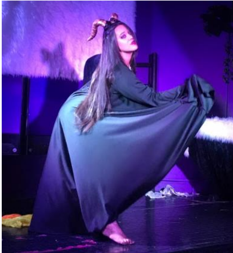
2. Puesta en escena Shadey. The Secret Garden.

sus deseos sexuales, sensuales y eróticos, los cuales transmite a través de su puesta en escena, maquillaje y vestuario.