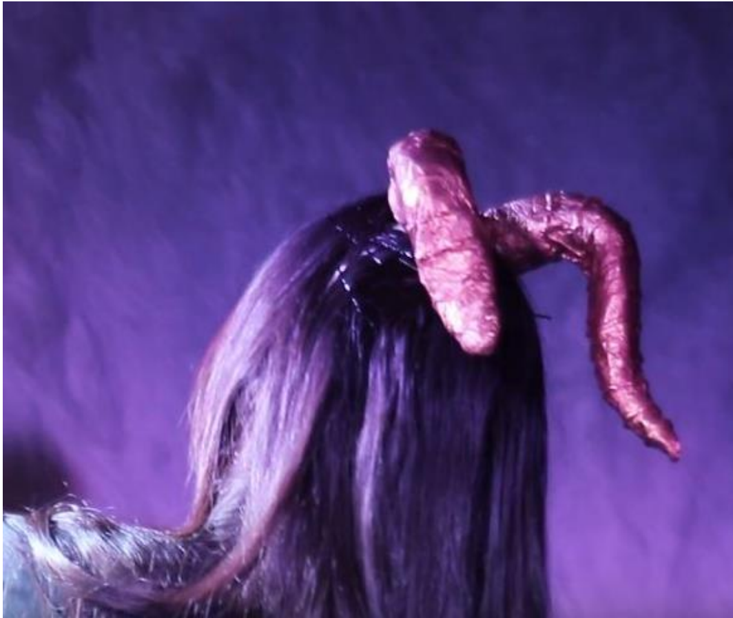
9. Vestuario Shadey, The Secret Garden, 2019.

Shadey, ve en su vestuario una forma de exteriorizar y reflejar los aspectos con los cuales se siente identificada, en este caso y en palabras propias del sujeto de estudio “el arte del erotismo”, es ese el mensaje que desea transmitir y el cual ha sido premisa a lo largo de su carrera artística y profesional.