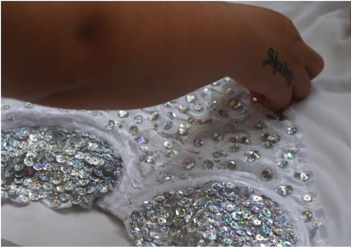
11. Construcción vestuario Shadey, 2019.