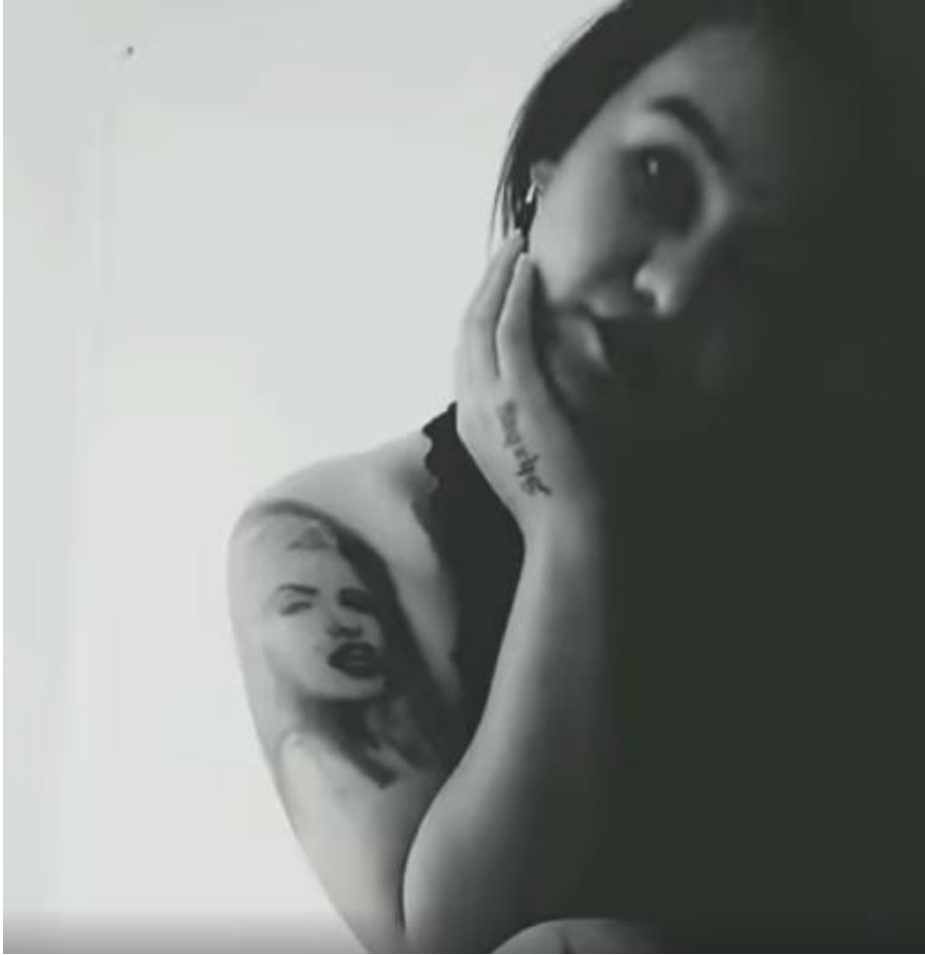
6. Tatuajes Shadey, 2019.

Continuando con el quinto tatuaje que se realizó, este es completamente relacionado con el erotismo, un concepto que forma parte de su día a día y del cual ha elaborado su propio significado, este tatuaje aún no lo ha finalizado, ya que abarca todo su muslo derecho, este tatuaje fue diseñado desde cero por un tatuador, el sujeto de estudio decidió plasmar este diseño en su piel ya que representa todos los fetiches de su público que ella ha conocido a lo largo de su carrera.