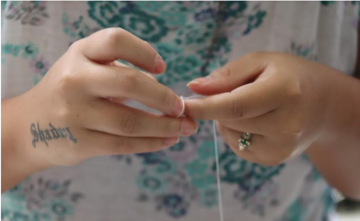
10. Vestuario Shadey, 2019.

“[...] nuestros vestidos, como objetos que manejan una relación tan íntima con nuestro cuerpo, actúan como una prolongación de nuestro interior, nos dotan de identidad y expresión, hablan por nosotros, se anteceden a las palabras cuando nos situamos ante la mirada del otro; hablan de nuestra procedencia, de nuestro oficio y actitud frente al mundo, de nuestros sueños y ficciones.” (p. 31).