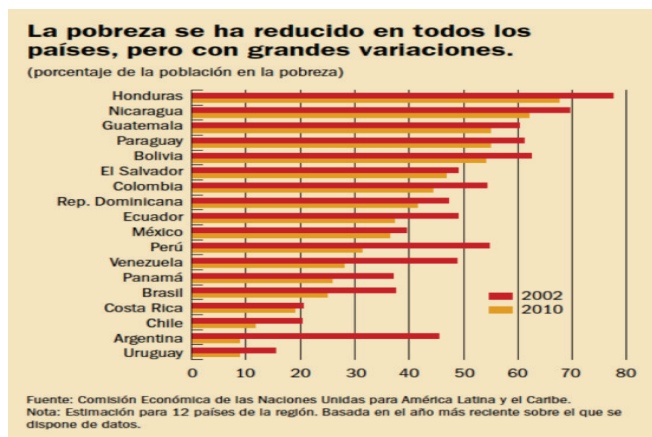
IMAGEN 1: Porcentajes sobre la pobreza en América Latina: (BÁRCENA, ALICIA. Finanzas & Desarrollo (revista del FMI).)

A continuación se ilustrará un poco de los porcentajes que se tiene sobre la pobreza en América Latina: