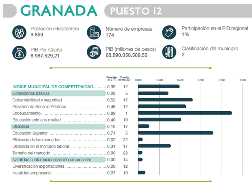
Ilustración 4 - Índice de Competitividad Municipal