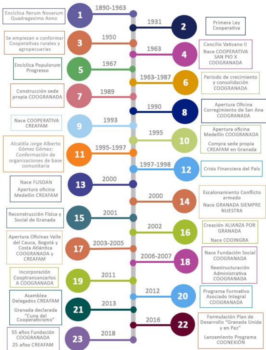
Ilustración 3 - Línea de tiempo del cooperativismo en Granada