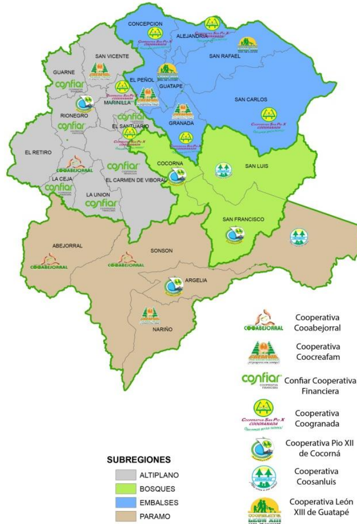
Ilustración 2 - Presencia territorial de las cooperativas del Oriente Antioqueño y Fusioan