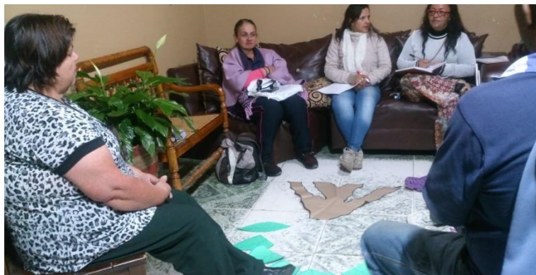
Fotografía 6 Técnica árbol de proyectos.

En el desarrollo de este taller también se habló del tema de autogestión, como una forma de gestionar recursos para ejecutar en favor propio, como es este caso de la JAC y el barrio Jimany Guanteros, y que una de las formas