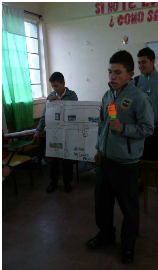
Fotografía 11 Presentación cartografía social.