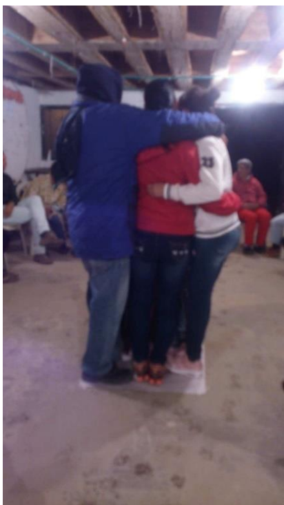
Fotografía 7 Taller Trabajo en equipo.

Lo anterior, dio pie a realizar un encuentro con toda la JAC con el objetivo de trabajar el tema “trabajo en equipo” enfocándolo a su vez a las responsabilidades y funciones que se tienen como socios al ser parte de este organismo comunal. Desde la lectura inicial a modo de introducción y reflexión hasta el cierre del taller, quienes asistieron mostraron una actitud positiva y participativa, poco a poco se fue ganando en la palabra y fue esto quizá la más importante reflexión que quedó del taller, la circularidad de la palabra siempre permitirá que las otras percepciones sean