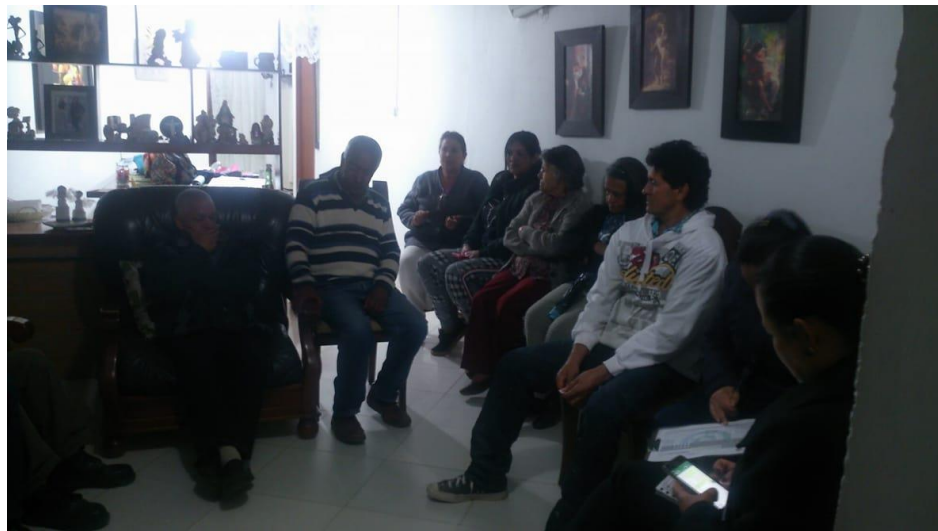
Fotografía 2 Barrio Barro Blanco

Apreciaciones: si bien la estrategia metodológica escogida para realizar los acercamientos a las JAC fue el taller, no hay que desconocer que en ocasiones lo planeado no logra ejecutarse de la forma esperada. Así pues, en estas dos JAC particularmente se realizaron los encuentros a partir de un tiempo limitado por el desarrollo de otros puntos en la reunión, y también la disposición de quienes asistían tanto a tomar la palabra como a hacer otro tipo de actividades que implicaran movimiento o trabajo en equipo.