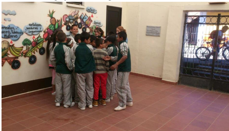
Fotografía 12 Taller grado 5° escuela Arenales

Para la realización del taller se utilizó el juego como estrategia de trabajo y vinculación al tema, puesto que la energía de los niños es tal, que se convierte en un reto mantener su atención; respecto al tema que convocaba, se logró que los niños tomaran la palabra y hablaran de las expectativas frente a su paso al colegio, ya que veían en esto la oportunidad de tener más profesores en su acompañamiento escolar, un espacio más grande, nuevos amigos, un paso más para cumplir otros sueños, y también hablaron de sus temores abiertamente. Frente a esto, se hizo el cierre del taller hablando de lo positivo y presentando algunos asuntos protectores que estarán en esa nueva etapa de la vida.