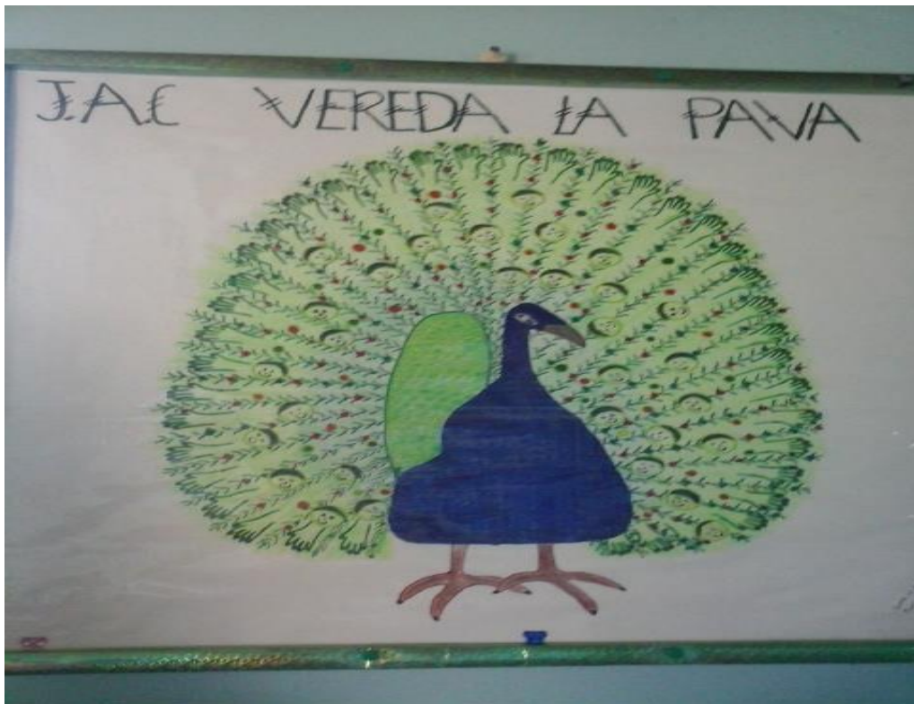
tomada en el 2015, en la vereda la Pava.

Esta fotografía, se configura como la imagen o el logo de la junta de acción comunal de la vereda la Pava, esta imagen simboliza el nombre de la vereda, aunque también está cargada del significado en relación a lo que más cultivan y lo