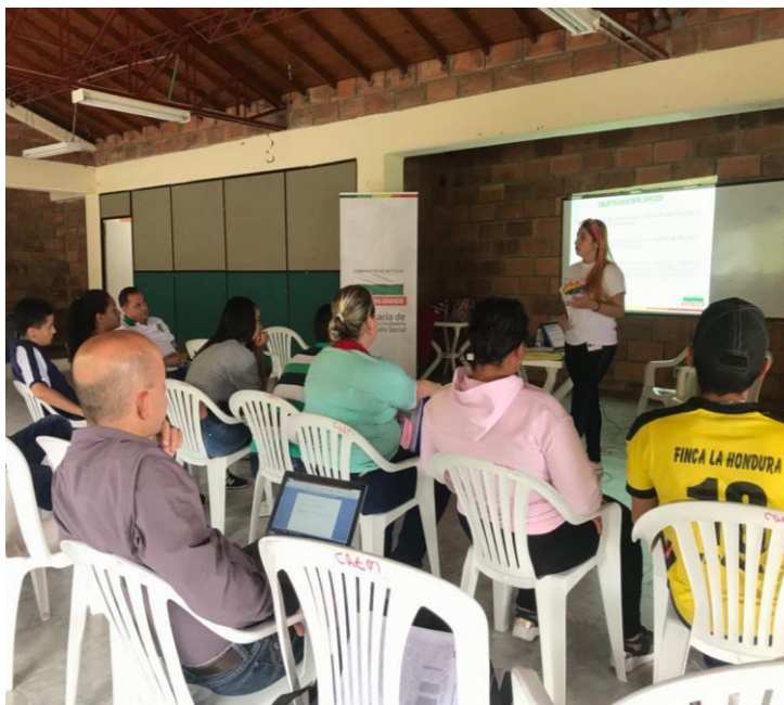
Imagen 3. Socialización del proyecto Antioquia Reconoce e Incluye la Diversidad Sexual y de Género en Betulia.

En cuanto al apoyo a las actividades de promoción de la participación, se realizó acompañamiento a los municipios de San Pedro de los Milagros y Betulia para la socialización del proyecto Antioquia Reconoce e Incluye la Diversidad Sexual y de Género y la respectiva concertación con las autoridades locales para la conformación de mesa diversa, esto se hizo por demanda de los municipios ya que estos no estaban siendo intervenidos por los profesionales.