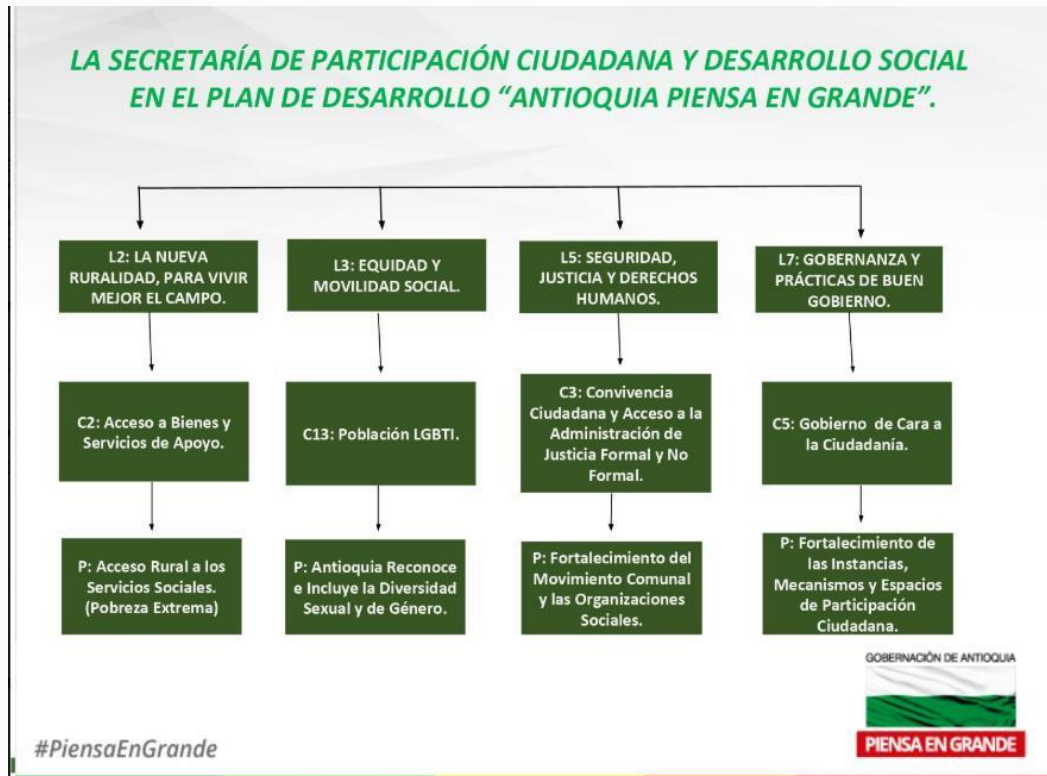
Imagen 1. Ubicación de la Secretaría en el Plan de Desarrollo.

De estas líneas, la Secretaría de Participación Ciudadana y Desarrollo Social, aporta en las siguientes: