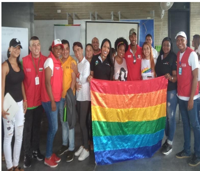
Imagen 4. Encuentro Subregional Urabá.

Así mismo se apoyaron las diferentes actividades realizadas en el marco de la semana de la participación, como lo fue el encuentro de movilidad social LGBTI del Valle de aburra, la entrega de resultados del Ministerio del Interior del estudio de territorialización de políticas LGBTI, el encuentro subregional de Urabá, donde se hizo, además una ponencia de derechos humanos con enfoque LGBTI; así mismo se apoyó la supervisión y lanzamiento de