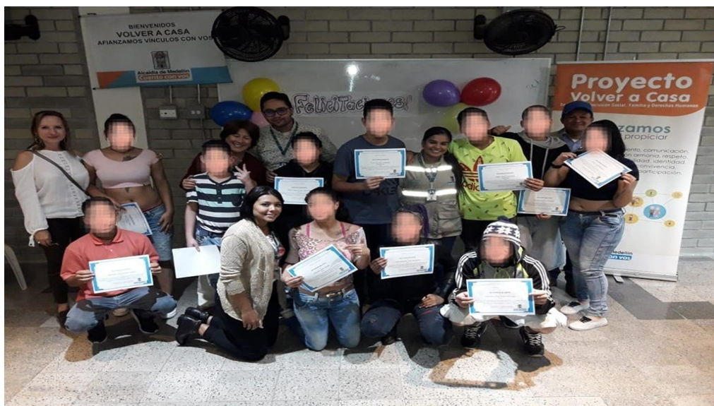
Mesa, M. (2018). Actividad de cierre y certificación de participación en el Proyecto de intervención. [Fotografía].