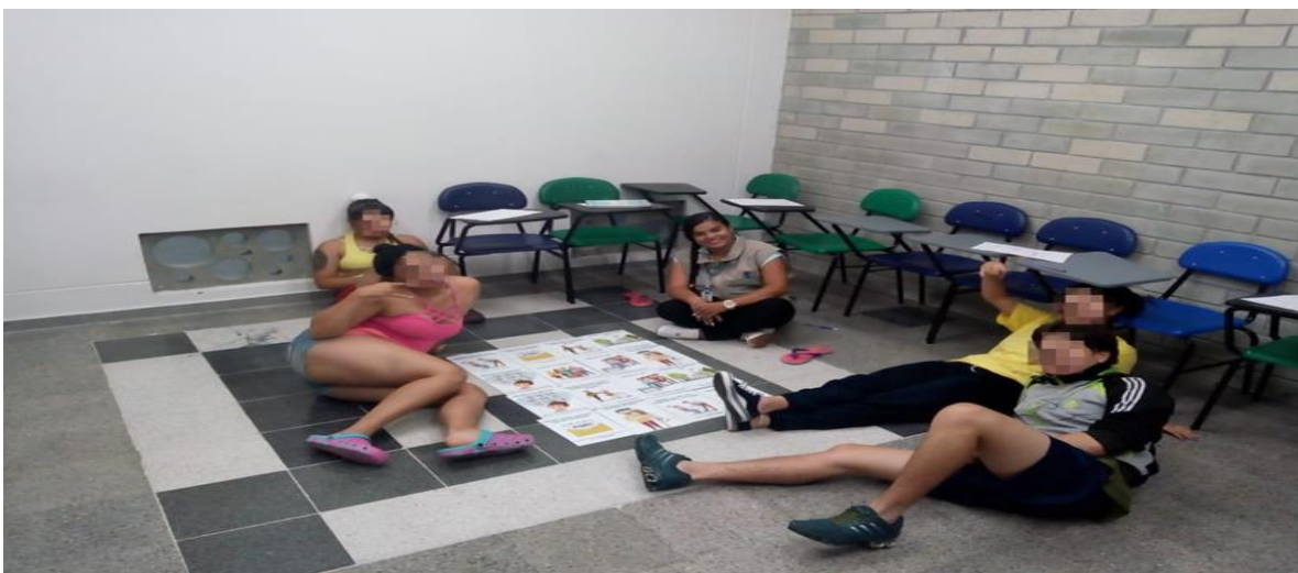
Mesa, M. (2018). Primer micro taller Derecho y deberes. [Fotografía].Fuente: Elaboración propia