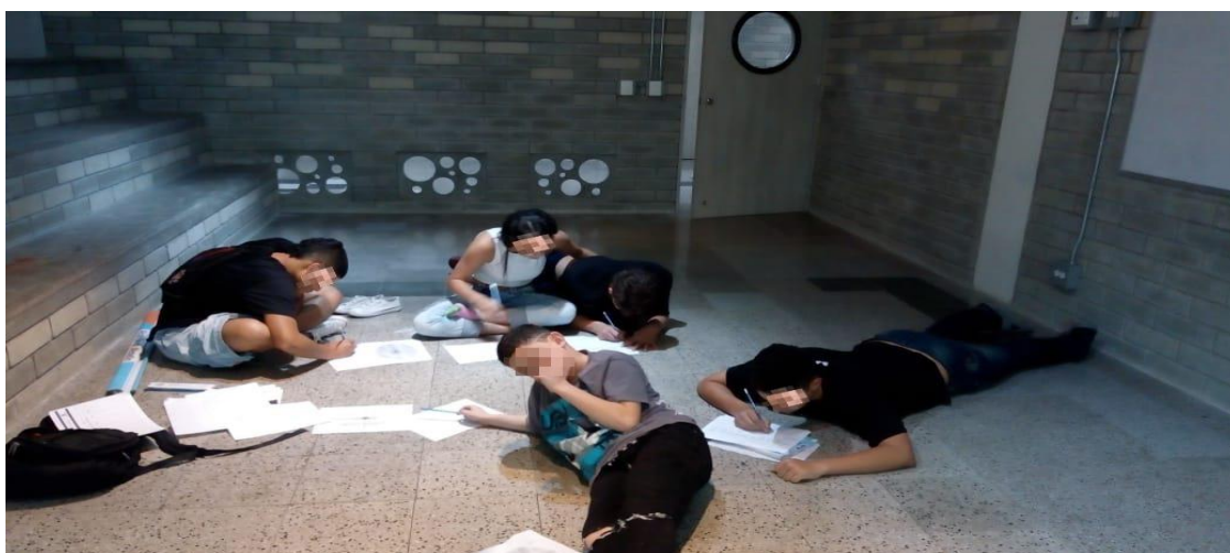
Mesa, M. (2018). Segundo micro taller Mapeo de redes. [Fotografía].Fuente: Elaboración propia