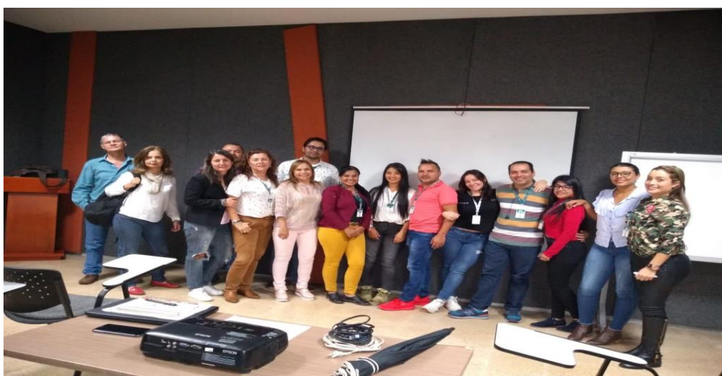
Mesa, M. (2018). Equipo de profesionales Proyecto Volver a Casa [Fotografía].Fuente: Elaboración propia