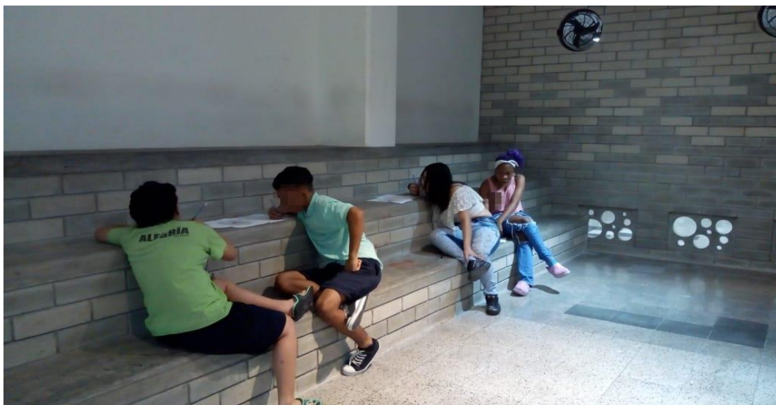
Mesa, M. (2018). Primer Micro taller Mapeo de redes. [Fotografía].Fuente: Elaboración propia