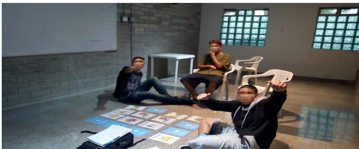
Mesa, M. (2018). Segundo micro taller Derecho y deberes. [Fotografía].Fuente: Elaboración propia