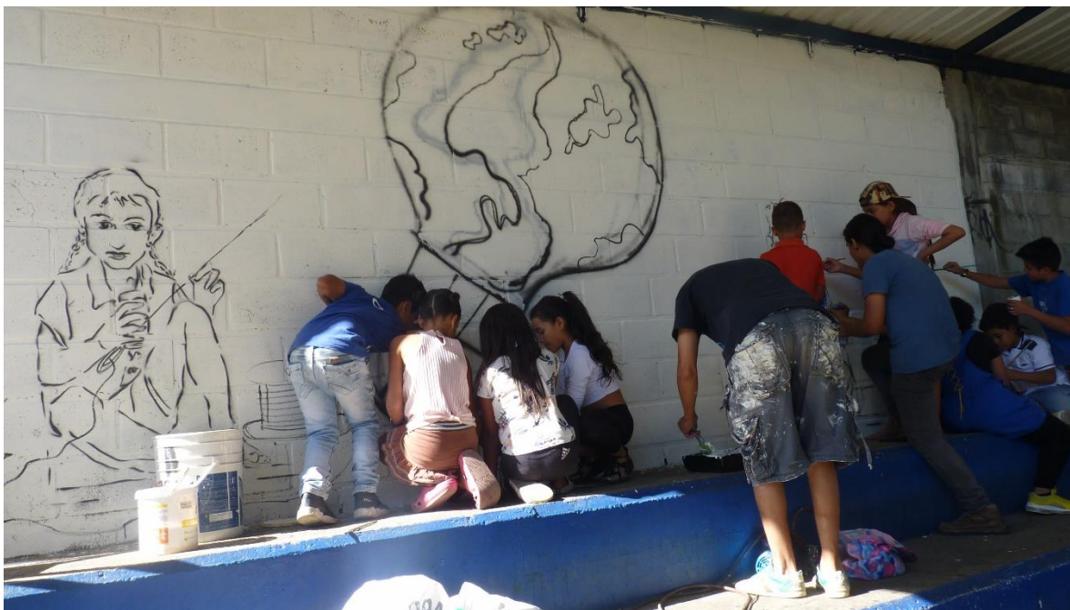
Figura 4. Mural en el marco la semana de la paz, La Frontera, año 2019.