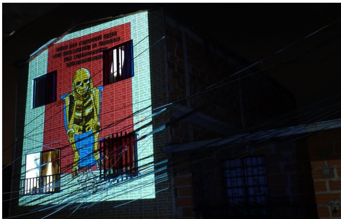
Figura 14. Proyecciones sobre muro. Junio 2020.