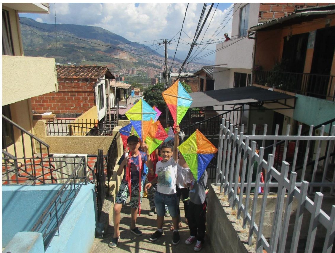
Figura 3. Tarde de cometas en el Cerro Quitasol, año 2017.

“Uno tiene recuerdos y eso significaba, según él, haber recorrido un buen tramo de la vida, de la existencia, sentir el tiempo transitar por las nostalgias” (Reinaldo Spitaletta, el sol negro de papá, 2011)