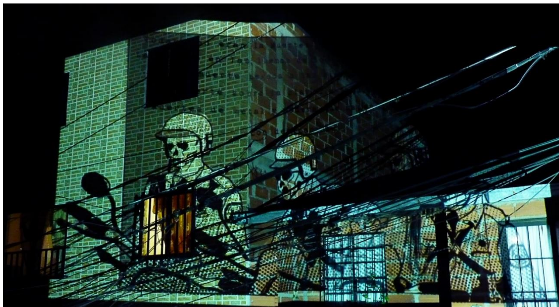
Figura 13. Proyecciones sobre muro. Junio 2020.

pared de la casa vecina, trabajo que hemos titulado historias para ser vistas desde el balcón . En las Figuras 13 y 14 se muestran los registros fotográficos de las imágenes proyectadas.