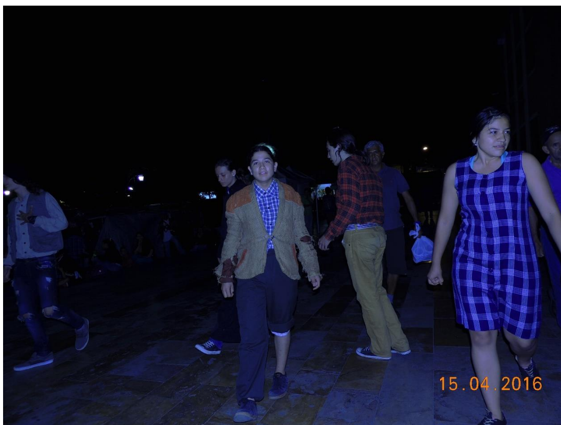
Figura 5. Obra de teatro en el parque de Bello, año 2016.

y allí se sentía que ambas cosas estaban pasando, pero como tengo un nombre muy largo, para los amigos soy Botones, para los conocidos y las personas del barrio Casa Botones, para la institucionalidad el nombre completo y con entonado acento, pero para quienes me han compuesto he sido un espacio de fuga donde pueden explorar otras formas de sentir, pensar y actuar, o quizás simplemente pueden preguntarse cómo Hamlet ¿ser o no ser?