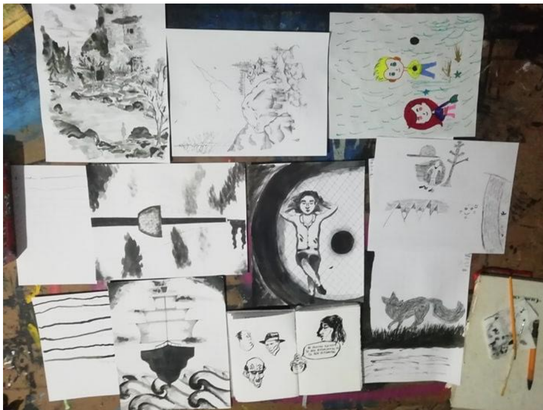
Figura 8. Trabajo de bitácora taller de cómic, año 2019.

Durante los primeros encuentros del taller de cómic, en las páginas de la bitácora se fueron depositando itinerarios, mitos, testimonios reales o ficticiales y relatos propios o ajenos que permitieron crear un caldo de cultivo al momento de construir las historias en imágenes.