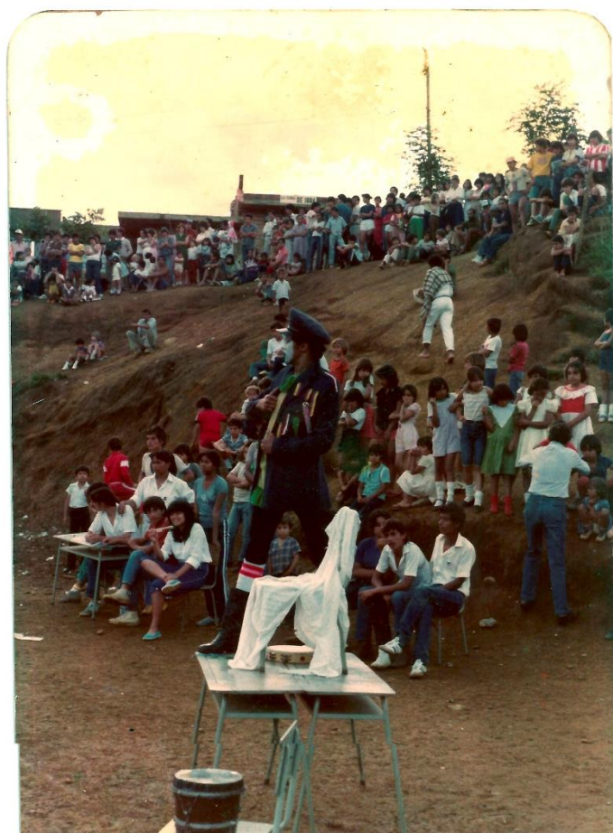
Figura 2. Tarde Cultural en 1983, sector de la cancha

“Es un homenaje a las mujeres y hombres asesinados, desaparecidos o desterrados que, desde el arte y la cultura, de modo individual o colectivo, lucharon por edificar con los habitantes de la zona otras alternativas y visiones del mundo; pero también, es un homenaje para otros artistas, líderes y colectivos que hoy están presentes y siguen con las búsquedas y luchas por vivir dignamente” (Hernández et al., 2013, p.10).