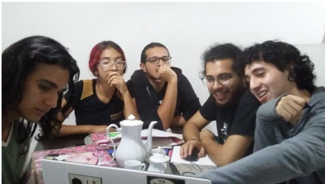
Figura 11. Finalizando un encuentro, febrero 2020. Archivo Gustavo Lujan

La cuarentena decretada a nivel mundial parece un acontecimiento sacado de un cómic. Establecer un aislamiento que sigue vigente en el momento de escribir este trabajo de grado, la militarización del Municipio de Bello por los altos número de homicidios y el miedo en las calles hace que nos veamos en la obligación de pensar nuestro trabajo en colectivo desde nuevas apuestas, ya que sin poder salir de nuestras casas surgen otras formas de encuentros para no caer en la angustia y el pesimismo de estos días de encierro, pues si,