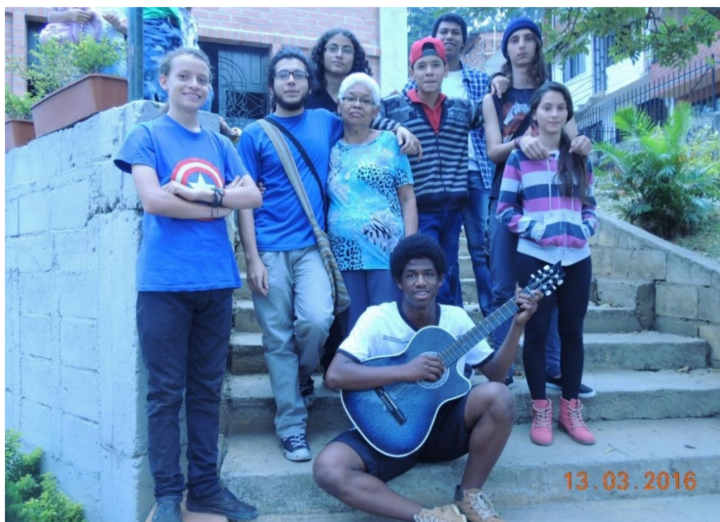
Figura 1. Jóvenes fundadores de la Casa Cultural Botones.

La Casa toma sentido con los relatos de cada participante, pues el botón -historia personal- se une al ojal -todas las historias de vida de los y las participantes- permitiendo el equilibrio. Esta Casa de puertas abiertas ofrece espacios alternativos de formación artística que potencia la creación erigiéndose como una esperanza de vida en medio de tanto joven vulnerado, marginado y asesinado.