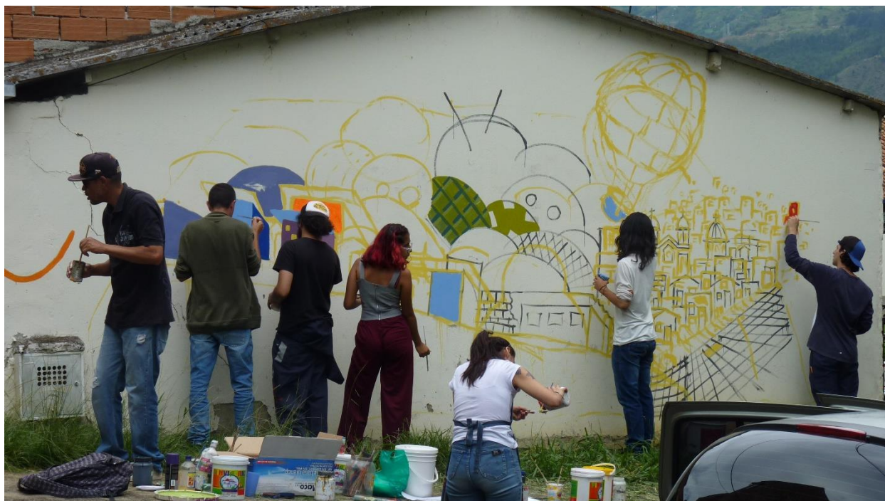
Figura 10. Mural realizado por el taller de cómic, noviembre 2019.

Es así que se ha ido alternando el taller de cómic con intervenciones murales entre stencil, pintura y dibujos realizados en distintos lugares del barrio, lo que permite al transeúnte encontrarse con anécdotas mientras camina y descubrir el quehacer del taller de cómic en su mirada.