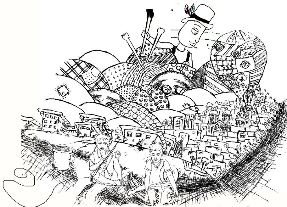
Figura 9. Trabajo colectivo para intervención mural en el barrio, octubre 2019.

Los muros se convirtieron entonces en lugares para contarles a los habitantes del barrio muchas historias y fue ese hacer que permitió caminar el territorio a modo de diálogo abierto.