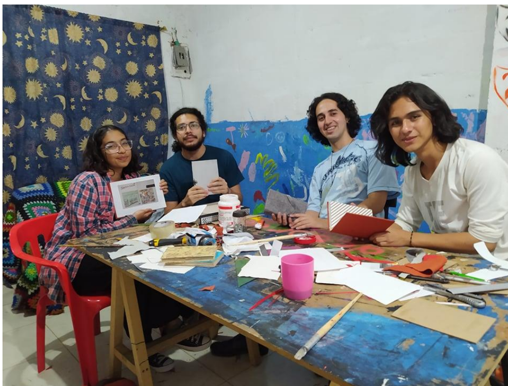
Figura 6. Taller de cómic elaboración de bitácora, año 2019.

Y en segundo lugar, el taller de cómic de la Casa Cultural Botones tiene un enfoque biográfico en esta investigación ya que ve en la historia personal la potencialidad del “relato que cada uno se hace de su vida debe poder hacer de él el sujeto y el actor de su propia historia” (Delory, 2015, p.18)