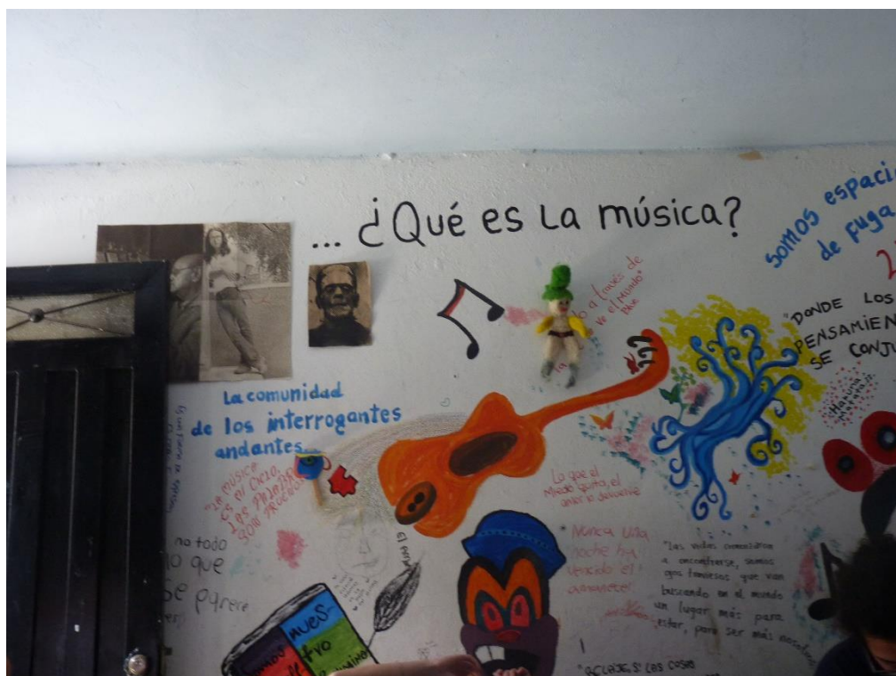
Figura 7. Mural inaugural primer espacio físico de la Casa Cultural Botones. 2017.

Dicen que el teatro es el comienzo del proceso de la Casa Cultural Botones; aún así sería faltar a la memoria omitir que siempre habitó entre los jóvenes de la Casa esa vocación por el dibujo y la pintura. Inicialmente se llenaron de trazos y colores los muros del primer espacio físico que acogió el sueño de construir una Casa Cultural en el barrio. Luego, salimos a las calles a representar la primera pieza teatral a quienes esperaban pacientemente cada miércoles las faenas del teatro: comunitario y urgente.