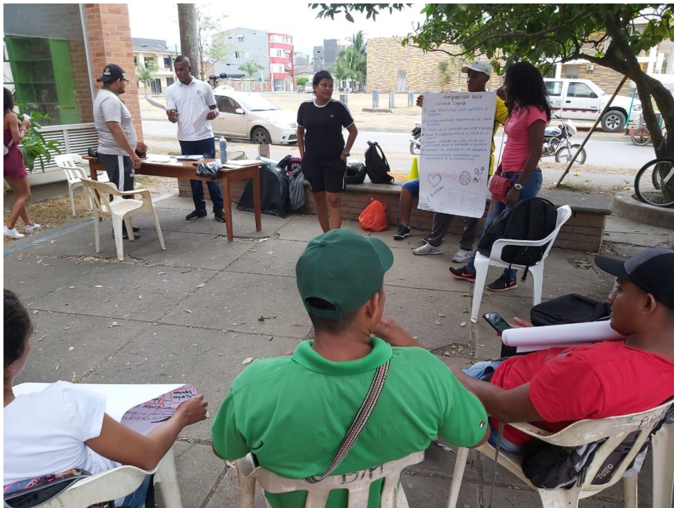
Desarrollo del taller 1. Trabajo en equipo