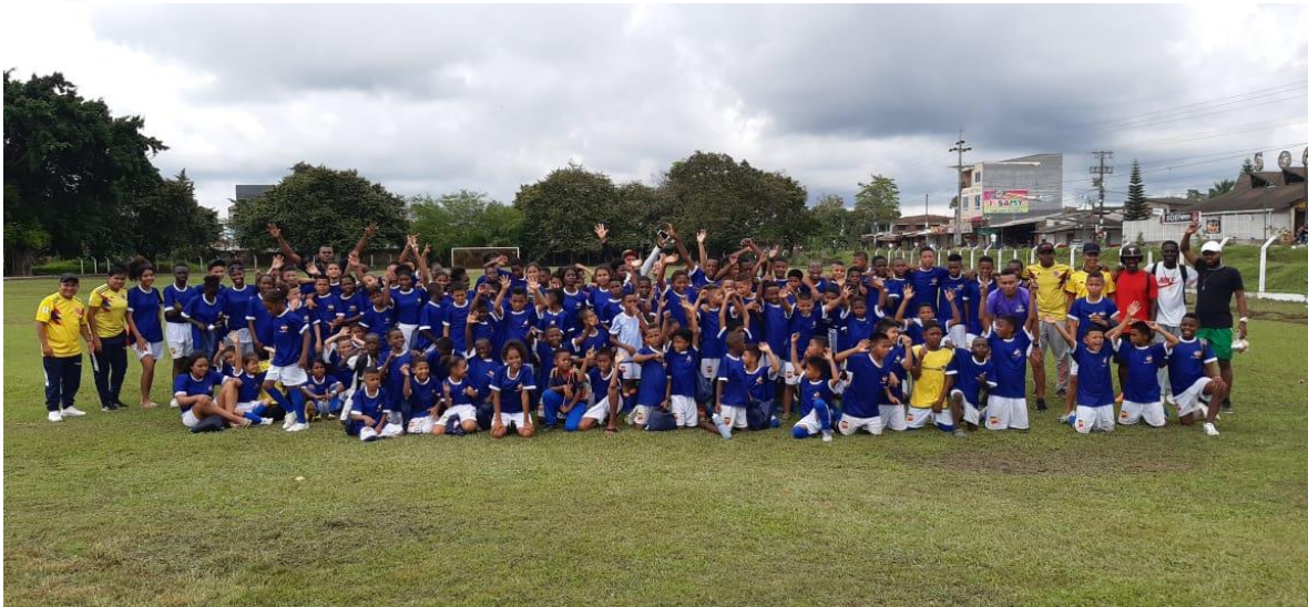
Acompañamiento al festival deportivo.