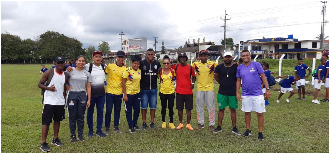
Líderes deportivo en el festival deportivo.