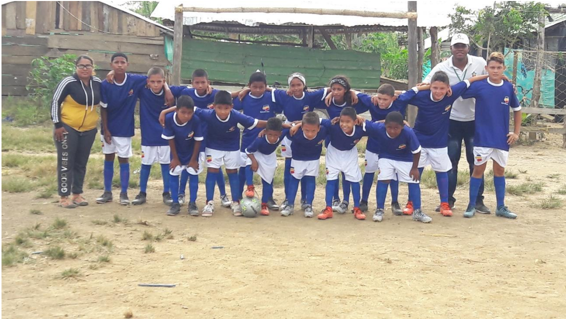
Acompañamiento a los espacios de entrenamiento de cada líder deportivo.