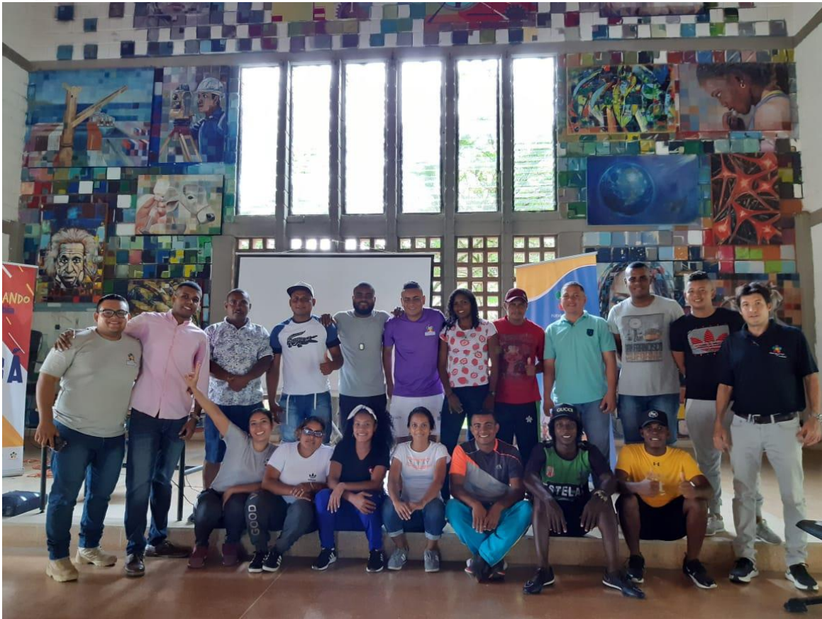
Semana de inspiración para líderes deportivos año 1 y 2.