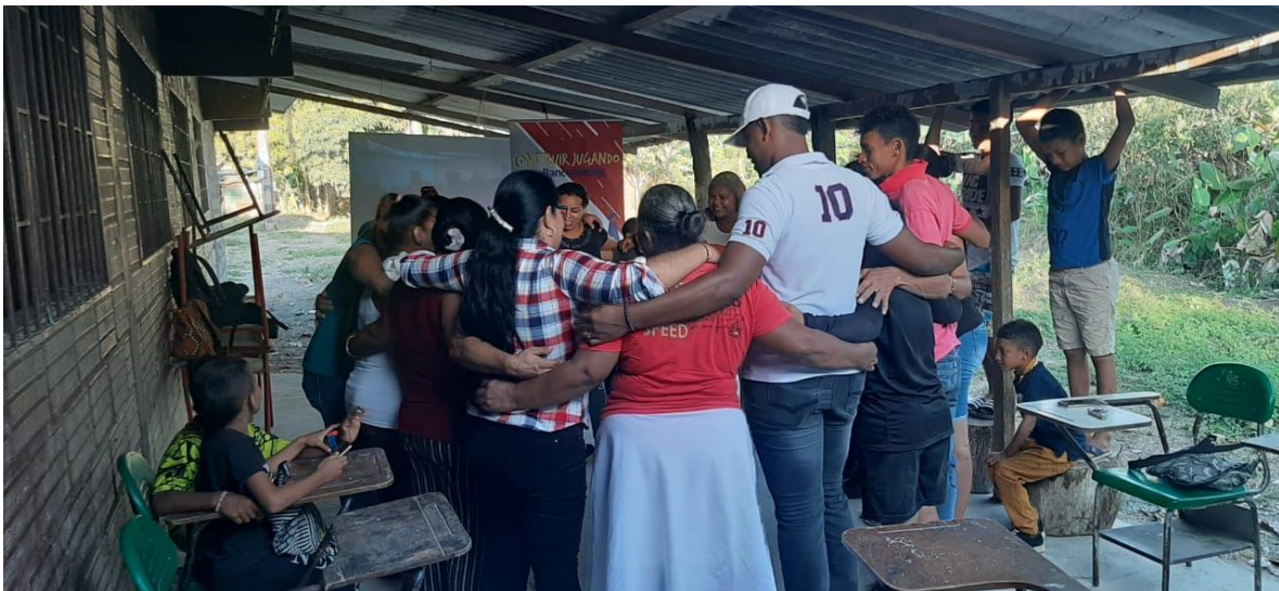
Acompañamiento a las actividades familiares.