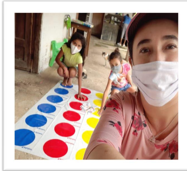
Imagen compartida a través del grupo de WhatsApp por familias participantes de cápsulas de saber-es el día 16 de noviembre/2020

Cabe resaltar que los programas radiales y el acompañamiento socio/educativo llevadas a cabo durante el confinamiento, fueron diseñadas e implementadas como equipo Psicosocial, todo esto fue posible al trabajo mancomunado que como equipo tuvimos durante este tiempo, estas estrategias son una pequeña muestra de todo el potencial que hay en el equipo, pues cada estrategia fue contundente, creativa e innovadora, nuestras manos y voces fueron artífices de los resultados finales.