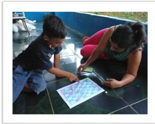
Imagen compartida a través del grupo de WhatsApp por familias participantes de cápsulas de saber-es el día 23 de octubre/2020.