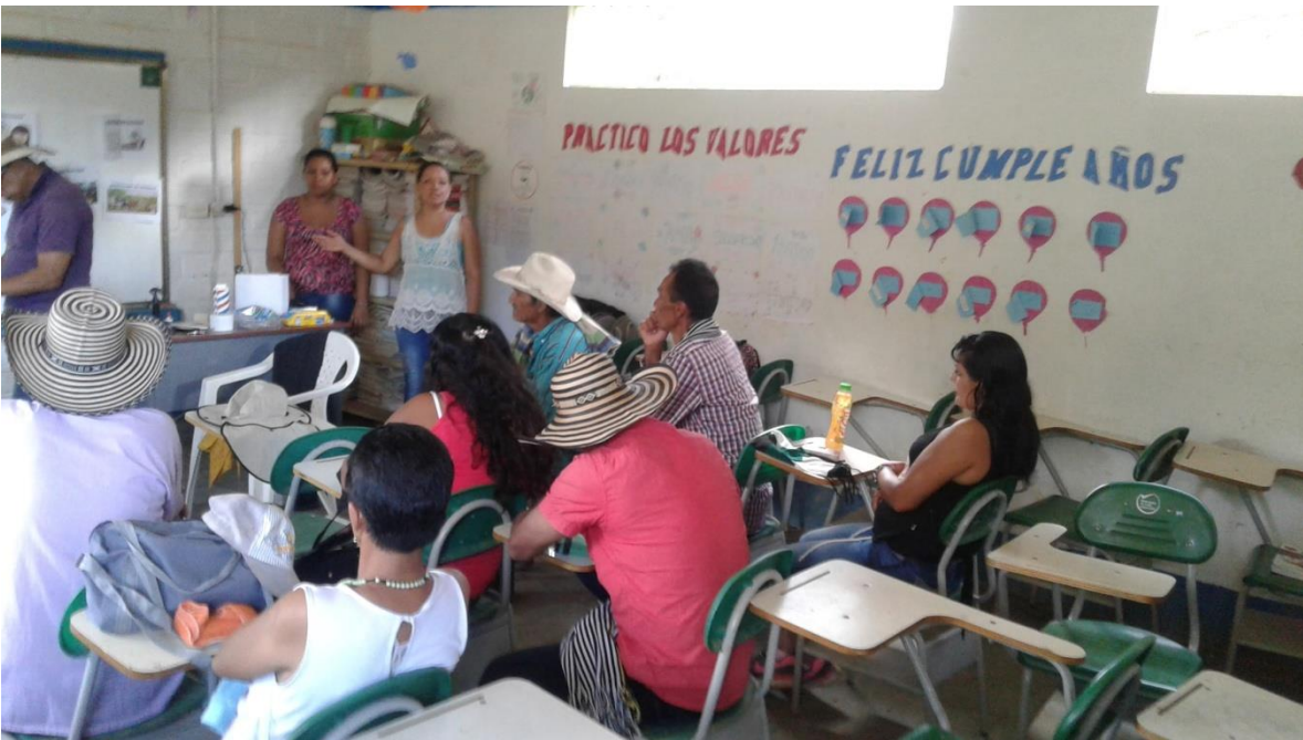
Formación y divulgación a niños, niñas y adolescentes. (protocolo de participación)