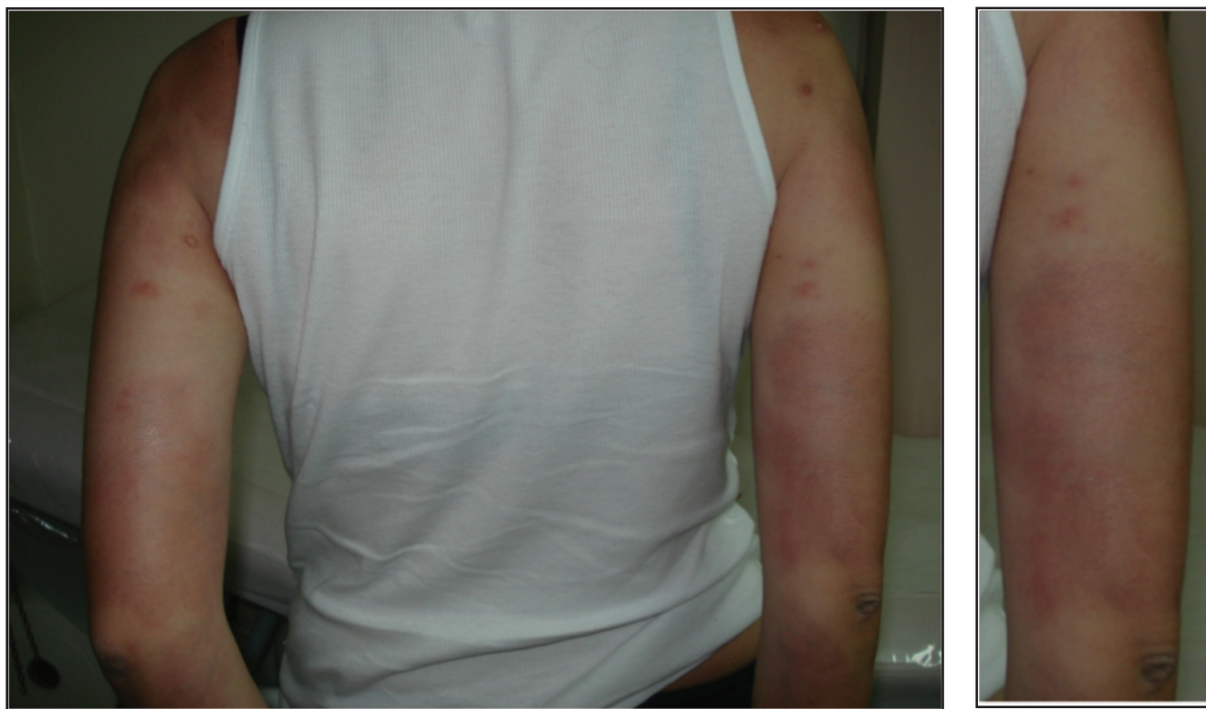
Figura 1. a. Máculas hipercrómicas simétricas no deprimidas en cara posterior de brazos. b. Acercamiento al brazo derecho.

Aunque el diagnóstico se basa en datos clínicos la biopsia de piel tiene un importante papel en la exclusión de otros diagnósticos (1). Algunos la han considerado una variante o una forma incompleta de la morfea (2). Para muchos autores podría llamarse indistintamente APP o morfea superficial (3-4). En una serie europea de 52 pacientes con esclerodermia localizada identificados durante 12 años en un servicio ambulatorio de medicina interna hubo 11 pacientes (21.5%) con diagnóstico final de APP. Todas fueron mujeres, la edad