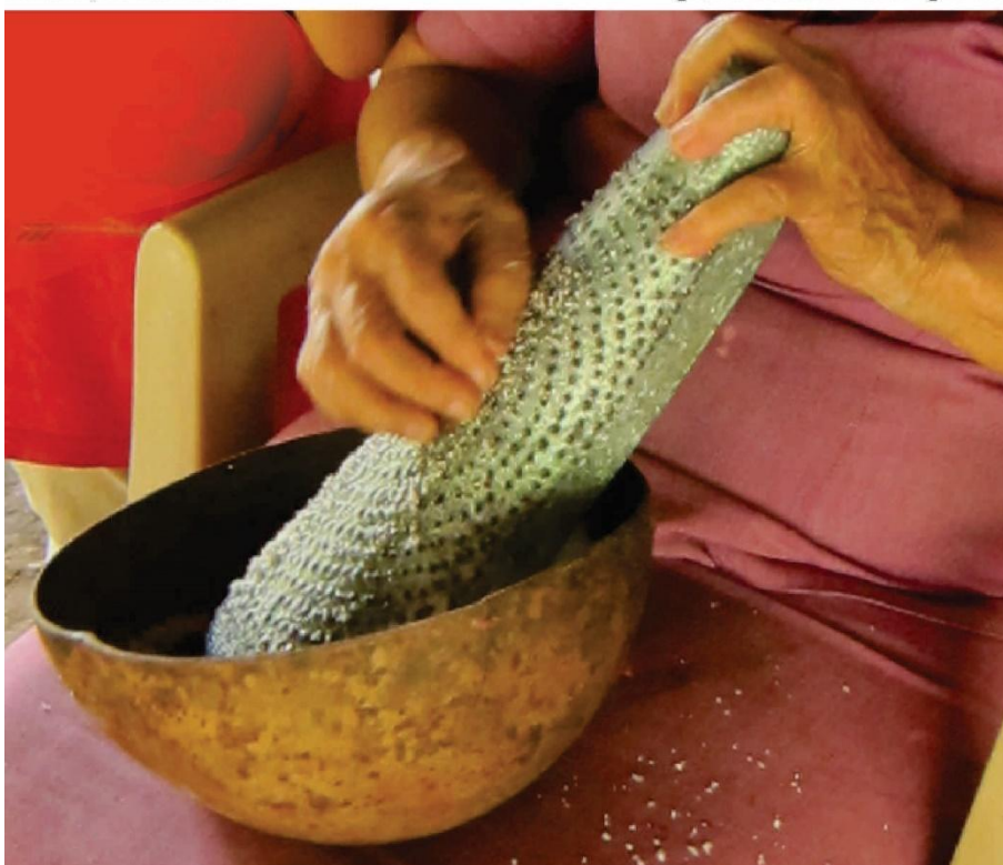
Totuma de rallar coco y tradicional rallador artesanal. Sinú Medio, zona rural