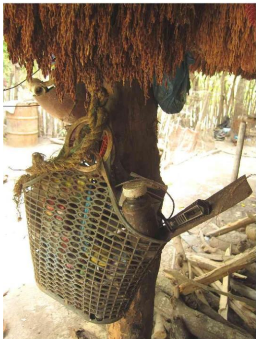
Uso del elementos de plástico, zona rural Sinú Medio