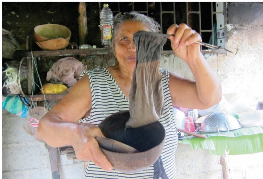
Totuma de colar el café con su respectiva cuchara y bolsa de colar. Corregimiento retiro de los indios, Zona rural, Cereté.