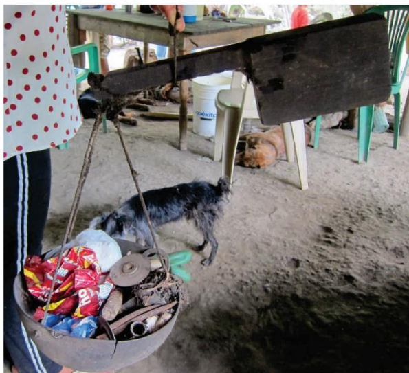
Peso de totuma en desuso, ahora como contenedor de pequeño objetos. Zona rural, Sinú medio