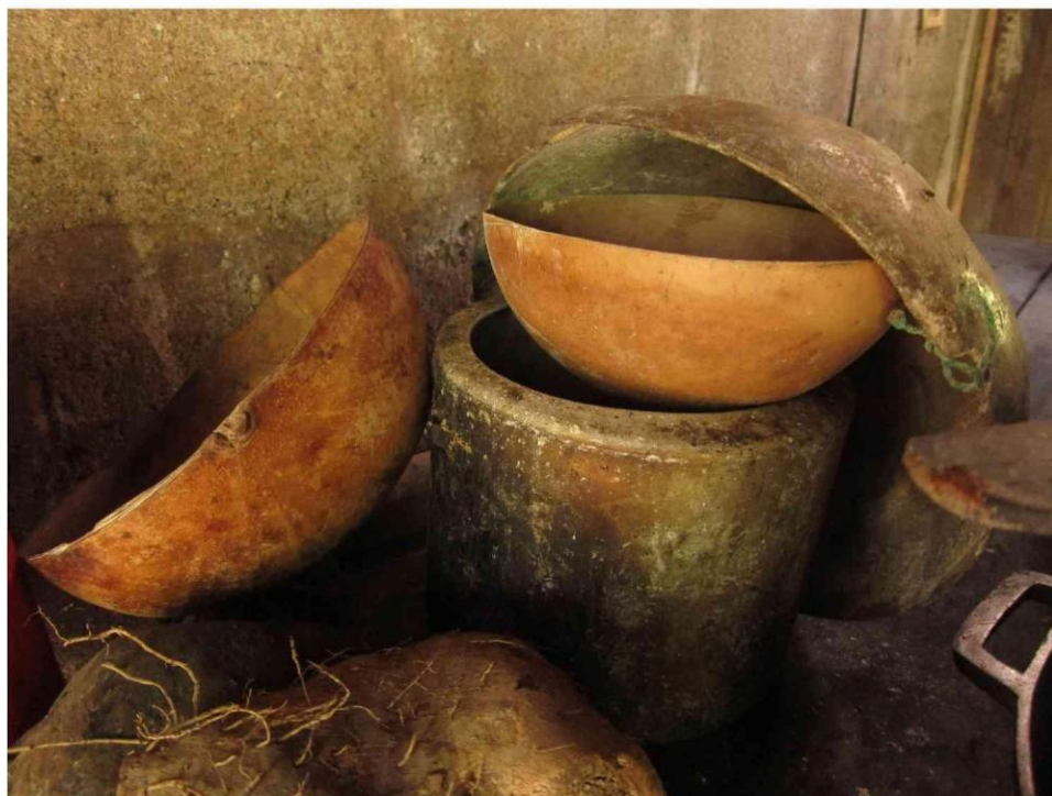
Bodegón cocina rural, totumas. Zona rural, Sinú Medio