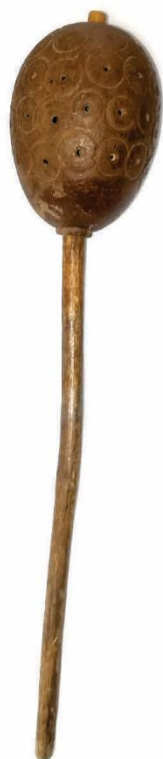
Achiotera utilizada para diluir la tintura de las semillas de Bixa orellana o achiote y darle color a las comidas. Colección propia.