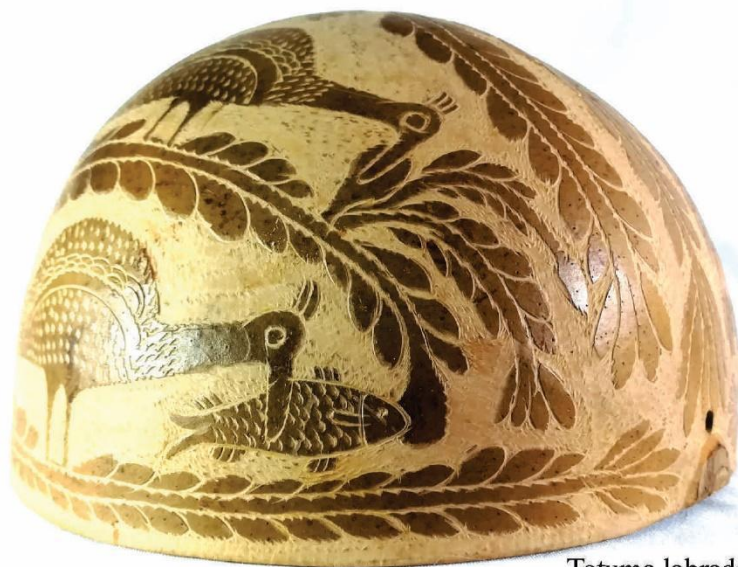
Totuma labrada. Colección propia.