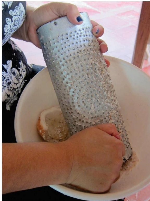
Reemplazo de la tradicional totuma de rallar coco por un utensilio de plástico. Zona rural Cereté