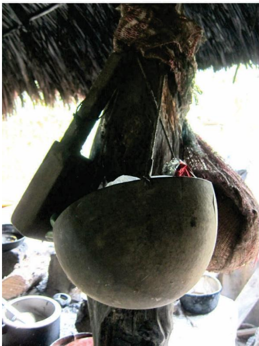
Peso de totuma (balanza) en desuso. Sinú Medio, zona rural