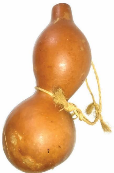
Bangaño usado para transportar agua.