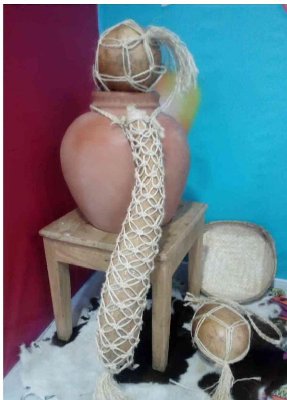
Artefactos del MAA como decoración en Centro comercial ciudad de Montería