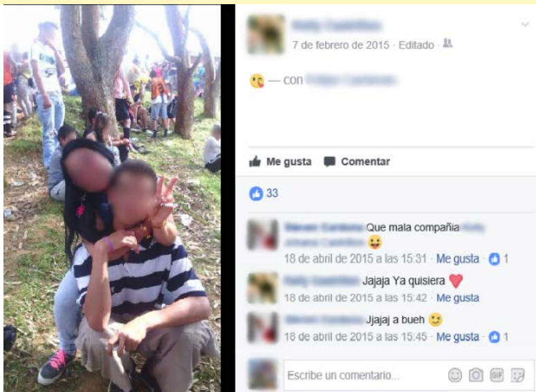
Imagen 3. Evidencia de emocionalidad iconográfica