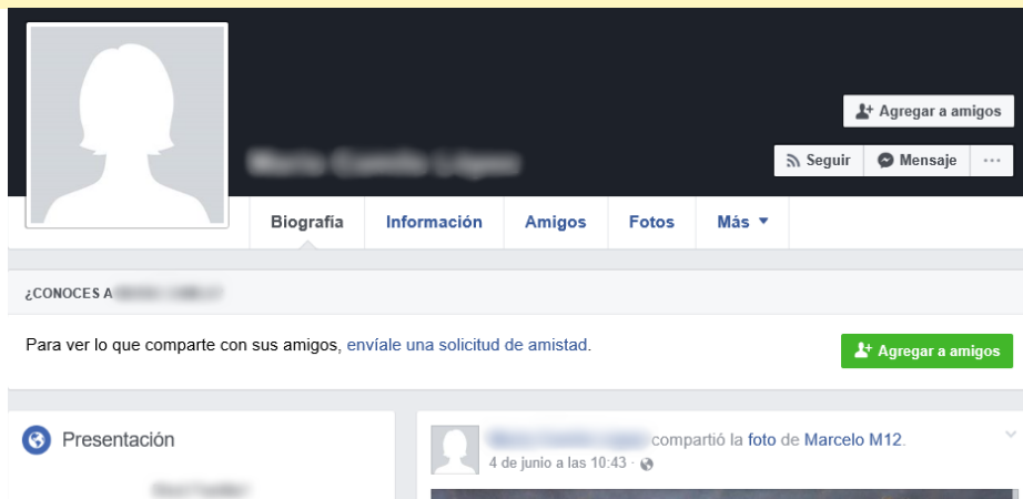
Imagen 5. Evidencia de inclusión y exclusión

Persona que interactúa en Facebook pero desisten de hacer uso de su imagen corporal