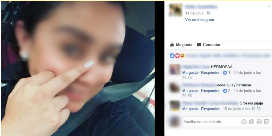
Imagen 6. Evidencia de los códigos gestémicos

Expresiones que dentro del escenario virtual parecen no tener connotación ofensiva