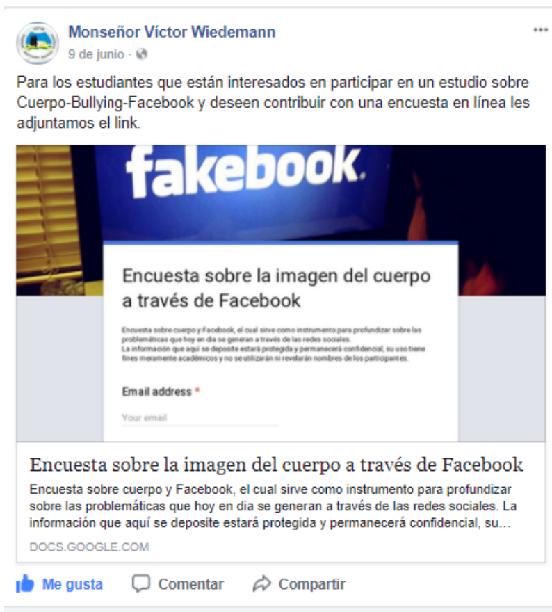
Imagen 1. Convocatoria en Facebook para la encuesta en línea

La encuesta se basa de una muestra poblacional (Alvira, 2011), para recolectar información precisa de forma verbal o escrita mediante un cuestionario estructurado.