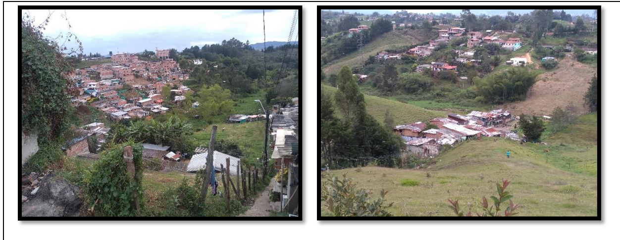
Figura 2. A la izquierda encontramos el asentamiento alto bonito parte 1 y a la derecha en la parte inferior se encuentra el asentamiento Alto bonito 2, en la vereda Abreo del municipio de Rionegro, fotografías propias (2020)

evidencia un sentido comunitario entre ellos. Todo esto nos lleva a plantear la desterritorialización de la vereda Abreo malpaso y la fragmentación en dos territorios en uno.