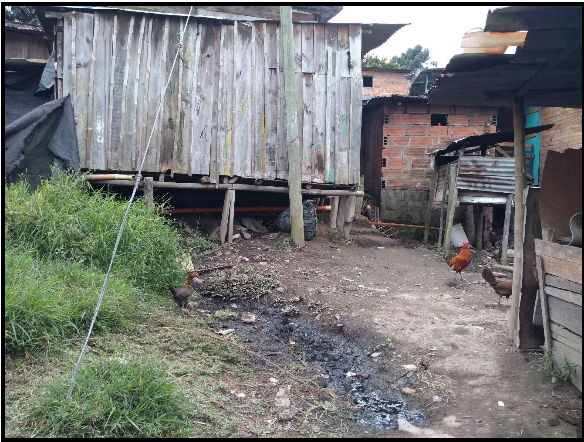
Figura 3. Asentamiento Alto bonito 2, se evidencian problemas en el manejo de las aguas residuales por falta del servicio de alcantarillado. Fotos propias (2020)

Dimensión ambiental: con la salida también se pudo observar y sentir malos olores a causa de la falta de alcantarillado, asentamiento de viviendas al lado de las riveras de la quebrada con alto riesgo de salubridad, una alta deforestación, basuras en algunas zonas al lado del riachuelo acumuladas con aguas residuales y condiciones ambientales adversas para jóvenes y adultos que con el tiempo, pueden representar problemas de salud por la contaminación que se presenta en el sector a causa de estas aguas residuales y el manejo de residuos.