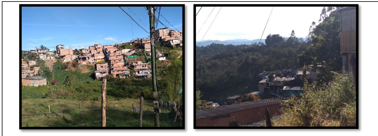
Figura 1. Asentamiento Alto bonito, vereda Abreo, occidente del municipio de Rionegro Antioquia.

Esta migración se ha intensificado con mayor fuerza en los últimos años por el conflicto armado que se vivió en los años 90 y la década del 2000 mencionado anteriormente; conflicto vivido más intensamente en municipios de San Francisco, Cocorná, Granada, San Luis y San Carlos, entre otros municipios y cuyo desplazamiento de estos habitantes, transformó las dinámicas de las periferias, el centro, las zonas urbanas y rurales de Rionegro, puesto que se convirtió en municipio receptor de estas personas.