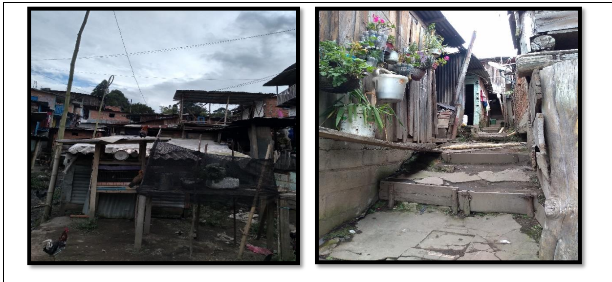
Figura 4 Construcción de casa en el asentamiento alto bonito 2, en esta parte del asentamiento viven aproximadamente 50 familias. fotos propias (2020)

manifiestan un alto índice de desempleo y altos niveles de inseguridad, lo que ha provocado una estigmatización generalizada por parte de otros habitantes de otros sectores del municipio, se observa una alta migración de personas externas al asentamiento y según las percepciones de los habitantes hay presencia de microtráfico con una ausencia por parte de las autoridades policiales e institucionales.