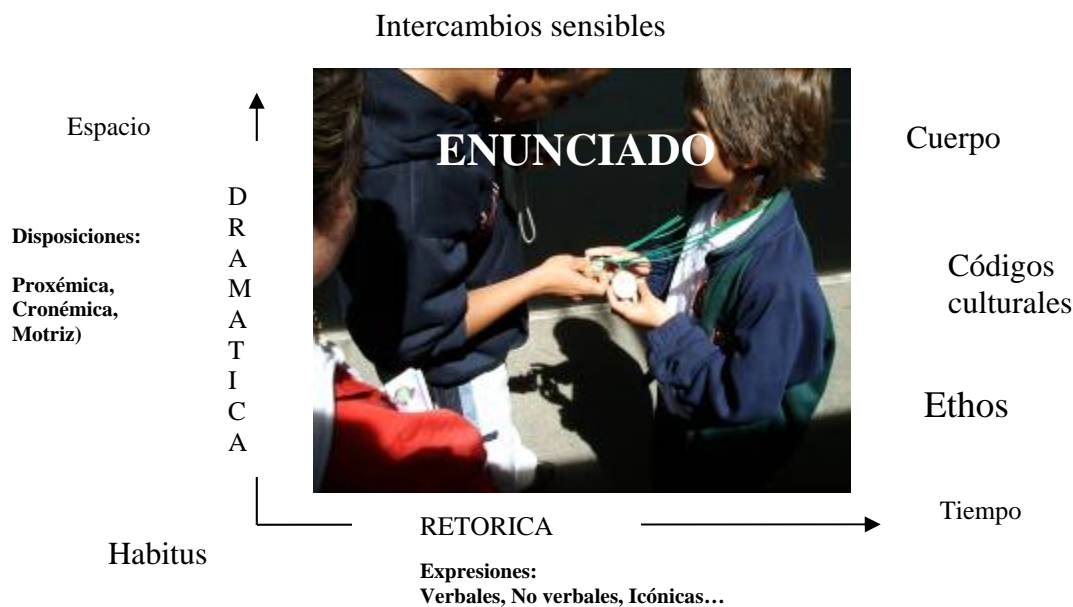
Figura 2. El lector IPC que proponemos para leer el drama corporal escolar.

El lector permite una aproximación comprensiva de los juegos, los consentimientos, las resistencias y los fraudes que se dan en la acción, en la conducta o en el acto mismo de intervención corporal por otro. Permite divisar, desde la forma y el sentido de las prácticas corporales escolares, el despliegue de los dispositivos de la subjetivación. En tal sentido acogemos la invitación de Mandoki (1994) a avanzar sobre la configuración de matrices de análisis situadas (en este caso desde la educación corporal). Desde allí intentar aproximaciones críticas al cuerpo en el drama escolar.