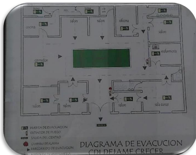
Diagrama de evacuación y planos del CDI Déjame Crecer