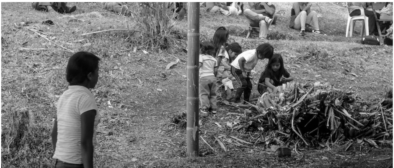
Fotografía 1. Wêt wêt fxi'zenxi ... Niños nasa jugando a tallar el fique. Resguardo Las Mercedes en Caldono (Cauca).

El Wêt wêt fxi'zenxi es una especie de práctica que se puede interpretar como lúdica (pero no se reduce a ello); entre la comunidad nasa traduciría lo que se conoce en español como “armonía”: da cuenta esta categoría a una práctica social, dado que siempre la acción conecta a dos o más sujetos de una comunidad, relaciones que pueden ser intergeneracionales (niños, jóvenes, ancianos), intersexuales (hombres, mujeres) o interétnicas (nasas, emberas, ingas, guambianos, campesinos, ciudadanos, etc.). A veces parecen juegos infantiles o adultos, actividades de resistencia, prácticas de ocio, medicinales, de supervivencia, de trabajo, de recolección de fruta, de disfrute, rituales, si es entendido desde la lógica de occidente, que es leído desde fragmentos y no desde la unidad equilibrada como lo concibe la comunidad.