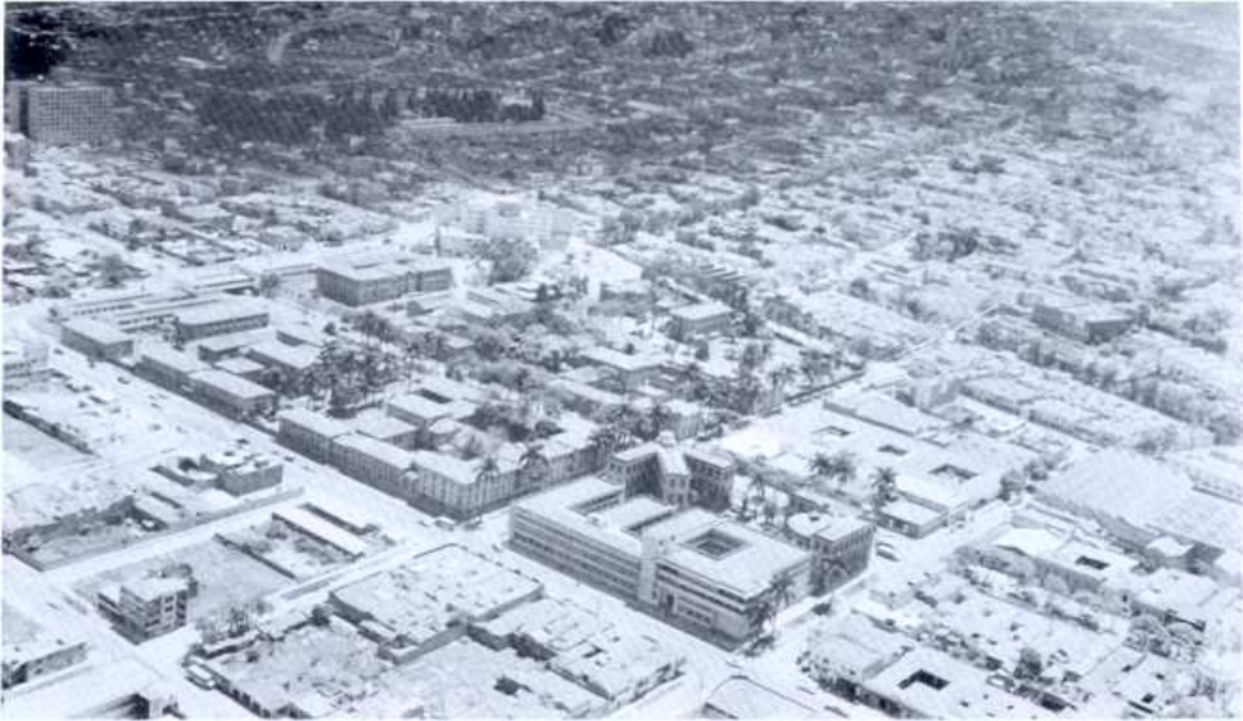
FIGURA N° 4

Fotografía aérea de lo que fue la Manga de los Belgas. Al fondo el cementerio de San Pedro; más acá el Hospital San Vicente de Paúl y más cerca la Facultad de Medicina. (Fotografía de Digar, hacia 1962).