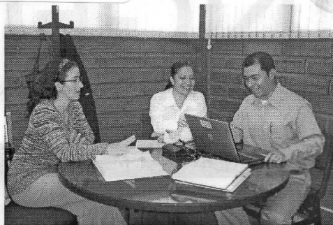
El Grupo Regional ISO cuenta con un equipo de 16 docentes asesores, y ofrece diversos programas de formación en Sistemas de Gestión de la Calidad

Después de que la U. de A., gracias al acompañamiento del Grupo Regional ISO, certificó un importante número de procesos, invitó a otras instituciones universitarias para acompañarlas en el mismo proceso y conformaron hace tres años la Red Universitaria de Extensión en Calidad –RUECA–. A la invitación respondieron las universidades de Pamplona (Norte de Santander), Pedagógica y Tecnológica de Colombia (Tunja), de Magdalena, de Córdoba, y la de Tolima. La Red opera exitosamente en lo académico y cuenta con el apoyo oficial del Departamento Administrativo de la Función Pública.