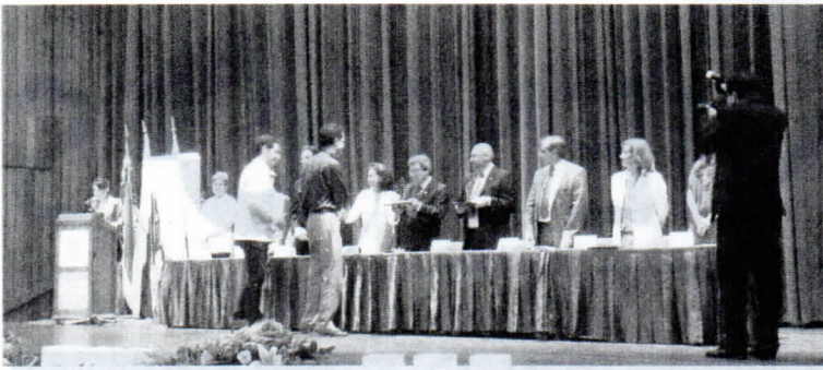
Arriba: Los bioingenieros recibiendo el Premio Otto de Greiff, en la ceremonia realizada en la Universidad Industrial de Santander, en Bucaramanga.