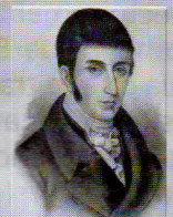
Francisco José de Caldas 1768 - 1816 2016 Bicentenario de su muerte

Facultad de Ingeniería Ciudad Universitaria Bloque 19 - Oficina 405 Teléfono: 219 55 87 http://ingenieria.udea.edu.co