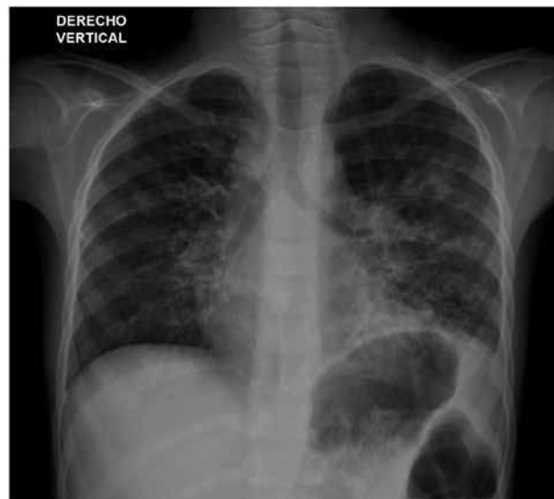
Figura 1. Radiografía de tórax. Evidencia el atrapamiento del aire con pérdida del volumen del pulmón izquierdo, opacidad basal izquierda e imágenes compatibles con bronquiectasias en ambos campos pulmonares.

Niño con 7 años de edad, hospitalizado por cuadro clínico caracterizado por astenia, adinamia, hiporexia, fiebre y dificultad respiratoria. La radiografía de tórax mostró la pérdida de volumen del pulmón izquierdo con opacidad basal ipsilateral (Figura 1).