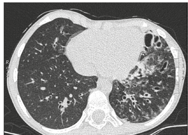
Figura 3. Tomografía de alta resolución de tórax. Se observa la presencia de cambios fibróticos subpleurales apicales bilaterales de predominio derecho, patrón en vidrio esmerilado hacia regiones parahiliares bilaterales de predominio izquierdo, múltiples bronquiectasias, atrapamiento del aire y pérdida de volumen del pulmón izquierdo. Fuente: propia, con autorización de los padres del paciente para su publicación

El examen neurológico encontró oculoparesia externa multiplanar, especialmente para la supraversion vertical, disminución de los movimientos sacádicos, presencia de reflejo optocinético, paresia del orbicular ocular y labial en forma bilateral sin paresia