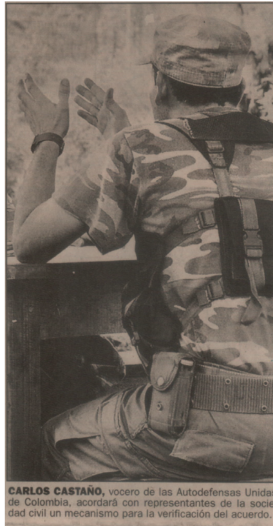
( El Tiempo , 1998d, p.6A)

Con cada imagen oscura y difusa que se publicaba, crecían las dudas sobre la naturaleza y las intenciones de los paramilitares. Esta expectativa resulta fundamental para entender por qué, cuando Carlos Castaño decidió mostrar la cara por primera vez, la transmisión fue materia de discusión en todos los medios nacionales. El periódico El Tiempo (2000b), por ejemplo, evaluó la pieza periodística con las siguientes palabras: