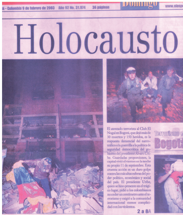
(Semana, 2003b, pp.26-27)

Para las FARC, el uso del terrorismo como instrumento de guerra suponía ventajas y riesgos. El aumento de la percepción de peligrosidad le permitía posicionarse como un actor militarmente fuerte, lo cual le había ayudado a presionar un proceso de diálogo durante el gobierno de Pastrana. Sin embargo, en el nuevo contexto internacional los costos de legitimidad eran incomparables. El terrorismo no solo impactaba cuantitativamente en la visibilidad del actor armado, sino también cualitativamente.