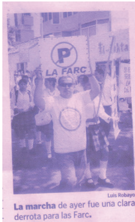
( El Tiempo , 2008b)

Hoy, el país sale a la calle a decir a una sola voz: no más Farc, no más secuestro. Todo colombiano amante de la paz, enemigo de la violencia, más allá de diferencias políticas o ideológicas, debe manifestarse hoy (...) Las Farc no son las únicas que secuestran, por supuesto, ni las únicas que practican la violencia o el terrorismo. Pero sí su manifestación más visible y poderosa, y por ello han congregado un repudio que tiene pocos antecedentes de parte del pueblo colombiano ( El Tiempo , 2008, p.1-16).