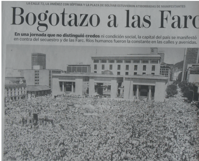
(El Tiempo, 2008a)

La "marcha de la rabia" ( Semana , 2008) o "la gran marcha" ( Semana , 2008a), como la denominó la revista Semana , fue uno de los acontecimientos históricos que mejor expresó la radicalización de la enemistad en el discurso de la prensa. Allí se evidenció, entre llamados a la movilización, hasta qué punto se había aceptado e interiorizado la idea de que las FARC eran el enemigo común de todos los colombianos.