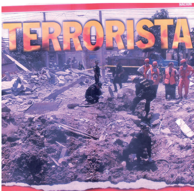
(Semana, 2003b, pp.26-27)