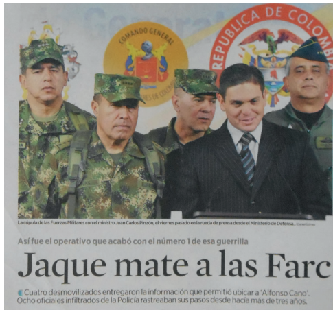
(El Espectador, 2011)

El cubrimiento de la prensa sobre los asesinatos de líderes de las FARC establecía un contraste dramático entre fortaleza y debilidad. Mientras que la prensa celebraba la grandeza militar del Estado y su fuerza para golpear al terrorismo, las FARC se "desmoronaban" (Semana, 2010c), se reducían simbólicamente a una simple presa de caza. Esto no significa que la dimensión