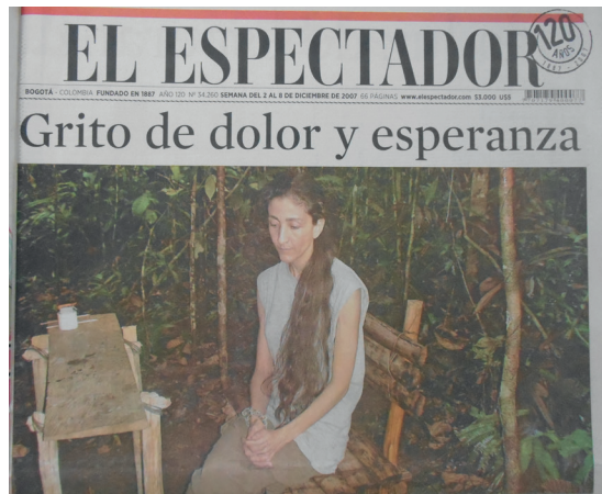
(El Espectador, 2007c)

los atentados terroristas en los centros urbanos durante 2003, pero sí intensificaban su descalificación moral. El correlato del sufrimiento de las víctimas era la “crueldad”, la “barbarie” y la “inhumanidad” de unos victimarios que eran capaces de infringir los peores horrores. Tales fueron las etiquetas con que se designó a las FARC y a sus acciones. El secuestro se convirtió así en el “símbolo” de la maldad guerrillera (Semana, 2012).