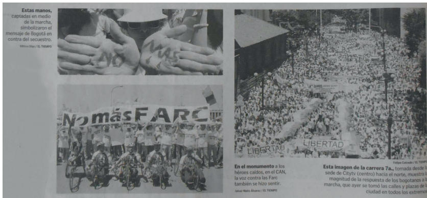
(El Tiempo, 2008a)