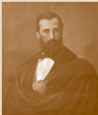
J.M. Vergara y Vergara

El historiador literario arriba señalado se propuso el análisis de la totalidad literaria nacional (todos los autores, las obras, los géneros y los fenómenos literarios) en el transcurso, también total, del tiempo (desde lo que el mismo historiador llama “inicios” de la literatura nacional hasta el momento de escritura de la historia). Vergara y Vergara publicó Historia de la literatura de la Nueva Granada. De la Conquista hasta la Independencia (1538-1820) , y se planteó empezar, hasta que la muerte truncó el proyecto, Historia de la literatura de la Nueva Granada. Cuadros políticos o días históricos (1849-1864).