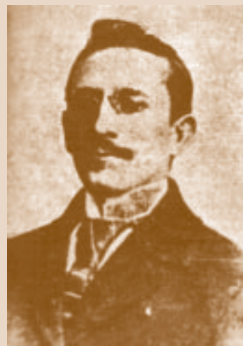
M. Vargas Vila

radica en la separación de España y en la aceptación del pasado cultural amerindio por parte de los liberales.