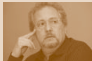
H. Abad Faciolince