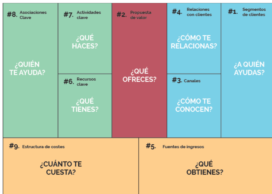
Gráfico 2. Estructura del Modelo Canvas