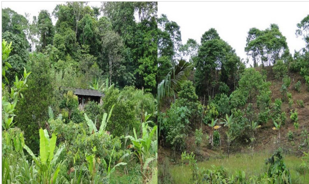
FIGURA 5. Sistemas productivos altamente biodiversos de culturas afro descendientes en Puerto Asís

El sistema de producción de pastos y diversos cultivos en terrazas y valles ofrece un amplio margen de aptitud para el desarrollo de los cultivos (ver Figura 5), pues las condiciones de topografía y suelos proporcionan diversidad y fácil manejo de la producción. La diversidad de especies, el desarrollo de los cultivos y la vegetación indican la capacidad y potencialidad productiva de estos suelos. Un factor negativo es el mayor riesgo a daños por inundaciones y a ser fumigados con glifosato para control de coca, que las autoridades en la región realizan sin medir consecuencia alguna.