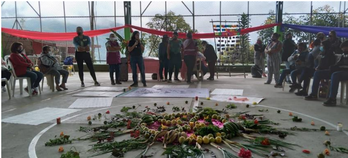
Figura 3 evento mujer rural y campesina.