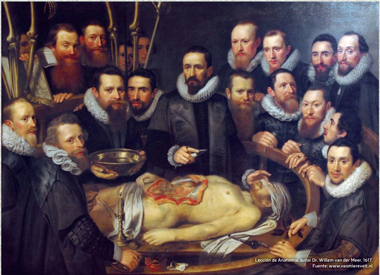
Lección de Anatomía, autor Dr. Willem van der Meer. 1617. Fuente: www.vanmierevelt.nl