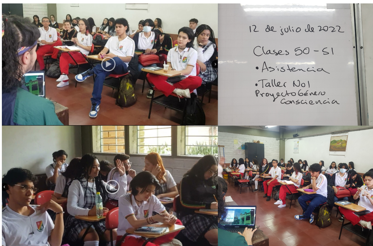
Imagen 4: Charla en torno a los usos sexistas del lenguaje.