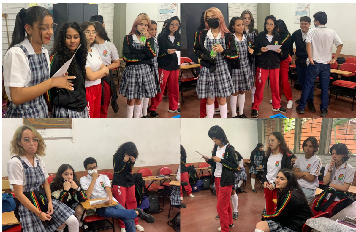
Imagen 1: Grupos conformados en la técnica del sociodrama (F-M-T-NB).