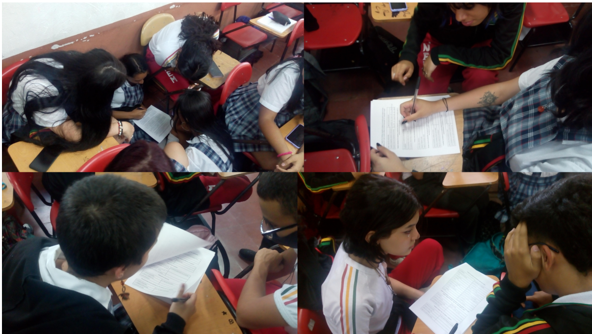
Imagen 9: Participación del Comité de Redacción en la construcción de las guías.