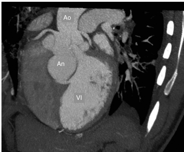
Figura 3 Angiotomografía de la aorta donde se evidencia el aneurisma del seno de Valsalva del lado derecho extendiéndose hacia el septo interventricular. An: aneurisma del seno de Valsalva, Ao: aorta, VI: ventrículo izquierdo.

mediante suturas de Prolene 4/0 con felpas (separadas) hasta la unión del anillo con el septo interventricular, en el defecto del seno coronario derecho se interpuso un parche de pericardio bovino con Prolene 5/0. Se implanta prótesis mecánica aórtica Regent® (St Jude) No. 21 con poliéster trenzado 2/0 sin felpas, se realizó rafia aórtica y al discontinuar la circulación extracorpórea se realizó ecocardiografía transesofágica intraoperatoria confirmando corrección del defecto hacia el septo, sin fistulas.