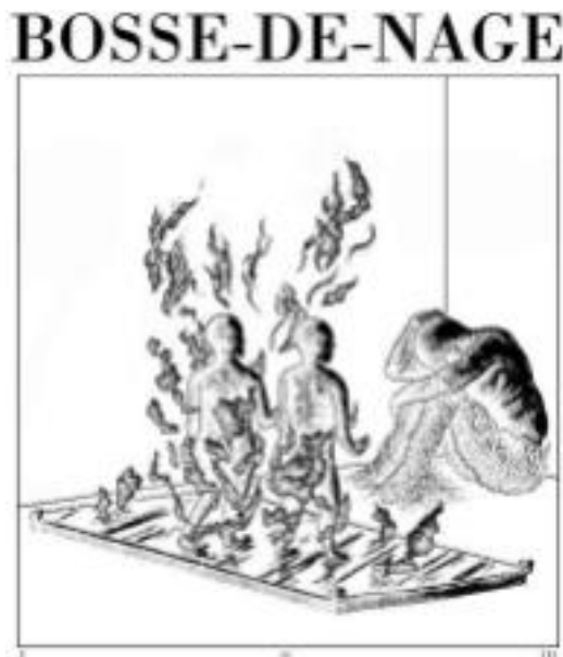
Ilustración de la canción “The God Ennui” por Jacob Rolfe

Nota: Publicado en el facebook oficial de Boss-de-Nage el 19 de febrero de 2013.