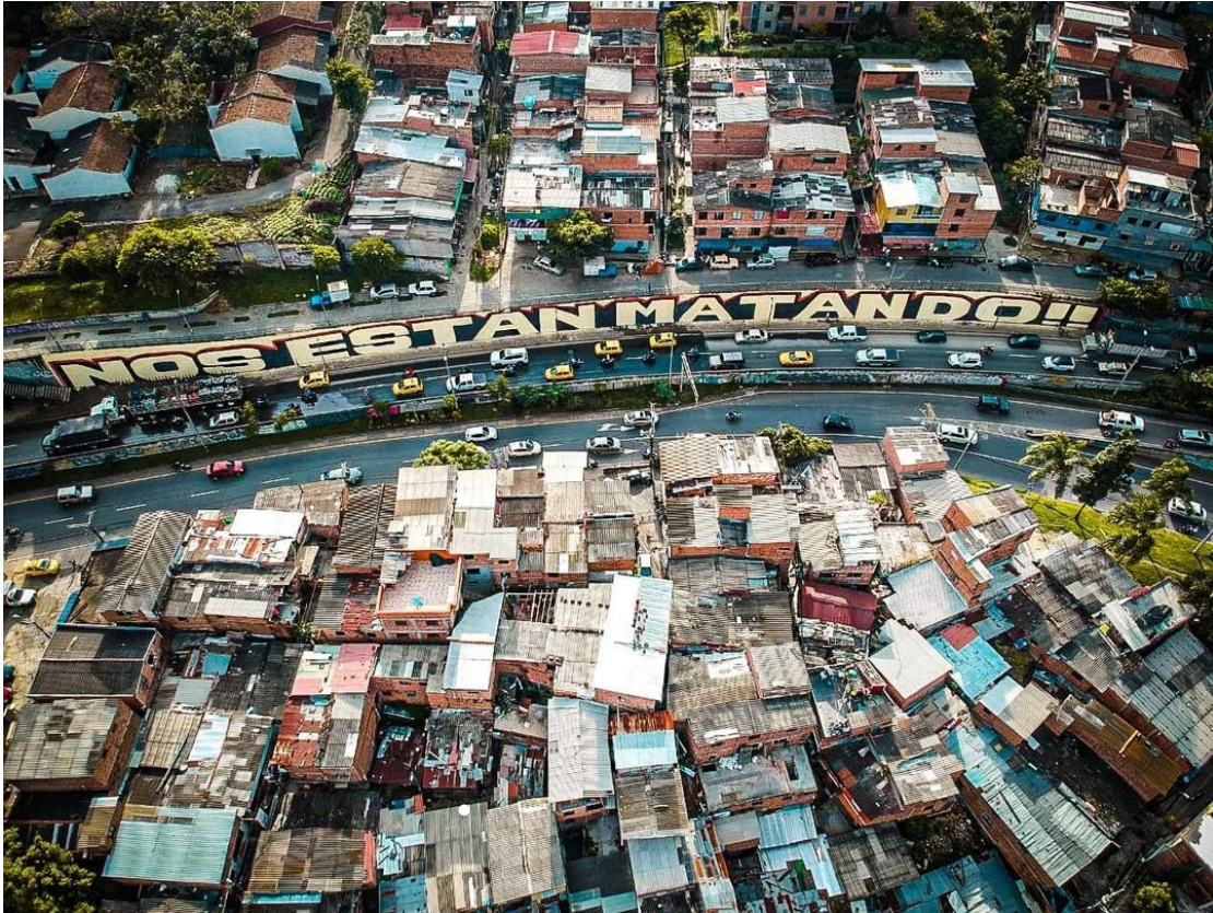
Fotografía mural "Nos están matando" paro nacional 2021

Estas imágenes nos muestran como el texto pasó de ser un acto netamente informativo y a ser mediador pedagógico a través de la acción artística, es decir, la figura uno enseña un primer momento, donde el creador del cartel quiso comunicar algo que sentía frente a los hechos que atravesaba la movilización social del país, sin embargo, el hecho de que se plasmara en un soporte de pequeño formato y que su intención fuese netamente el transmitir su sentimiento de inconformidad con lo que sucedía en medio de la movilización, enmarcaba este gesto en hecho simple de transmisión de un mensaje.