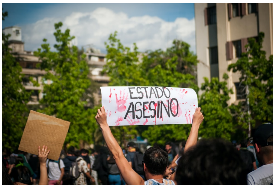
Cartel y manifestante

Nota: Fotografía digital cartel y manifestante paro nacional 2021