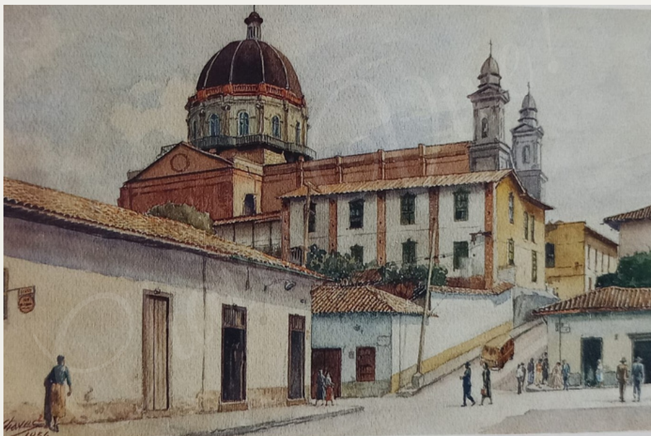
Humberto Chaves Iglesia de San Antonio Óleo sobre lienzo - 1956