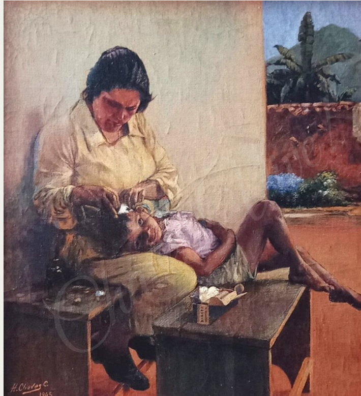
Humberto Chaves - Curando la herida Óleo sobre lienzo - 1945