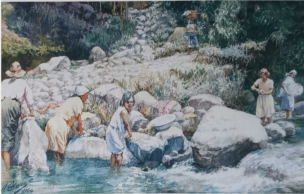
Humberto Chaves Lavanderas Acuarela -1964