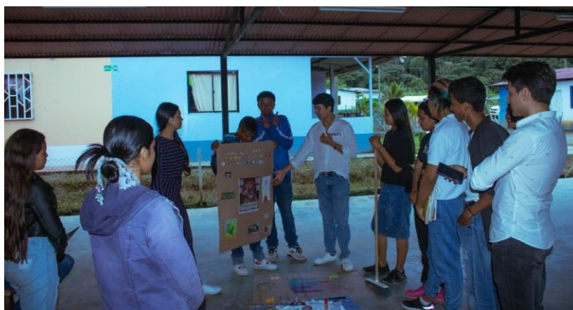
Imagen 9. Socialización de los pósters.

En consecuencia, los procesos de perdón y reconciliación adquieren facultades pluralistas y heterogéneas, y se consolidan gracias a las acciones de co-creación comunitaria que, según lo hallado en esta investigación, es crucial en la construcción de paces y que vale la pena seguir estudiando. En este sentido, el perdón y la reconciliación deben promoverse, idealmente, a través de procesos comunicativos donde se permita el empoderamiento de las comunidades, el encuentro de saberes y experiencias, la construcción de lazos de respeto y empatía, y la resignificación de contextos y situaciones. Esto, en últimas, motiva a las comunidades mismas a seguir movilizándose pues se ven incluidos, valorados y referenciados en aquello que se co-crea. Este accionar colaborativo se vuelve indispensable para entender cómo hacer paz en los territorios ya que, como lo afirma Barbas (2012), “el conocimiento no es algo dado o transmitido sino algo creado a través de procesos de intercambio, interacción, diálogo y colaboración” (p.166).