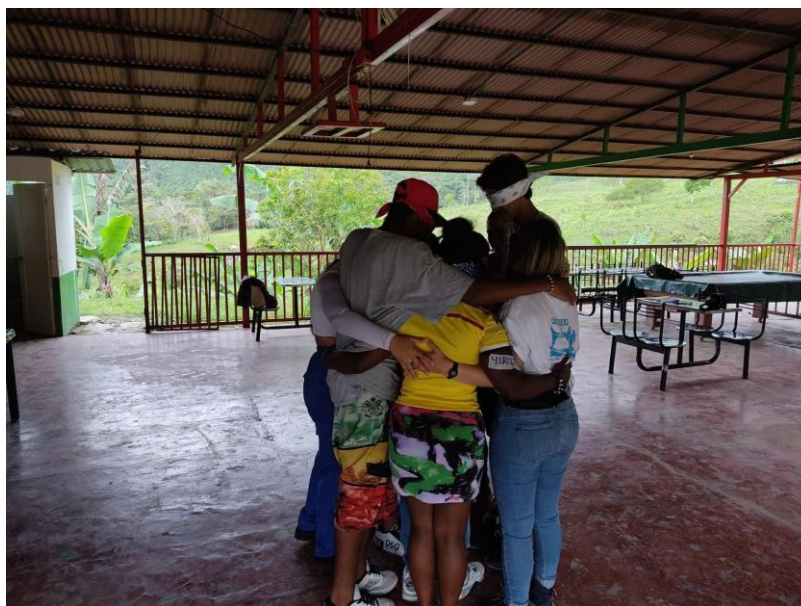
Imagen 1. Actividad: Caminata de confluencias.

A raíz de lo anterior, el grupo de participantes coincidió en que los procesos de perdón y reconciliación en el marco de la reincorporación comunitaria, derivada de los Acuerdos de Paz