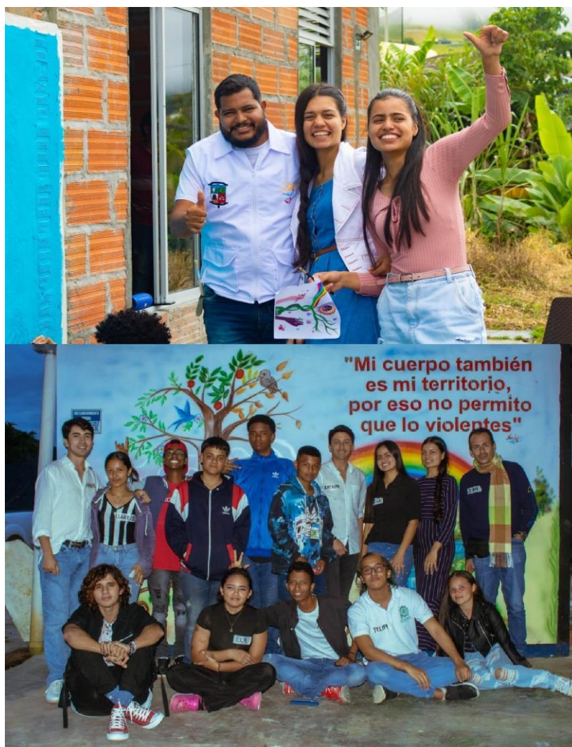
Imagen 6. Talleres en Llanogrande.

En últimas, es en torno a la co-creación donde el grupo de participantes encuentra nuevas posibilidades para la sostenibilidad de los procesos de perdón, reconciliación y paz, y la configuración de una sociedad responsable y promotora de estos asuntos.