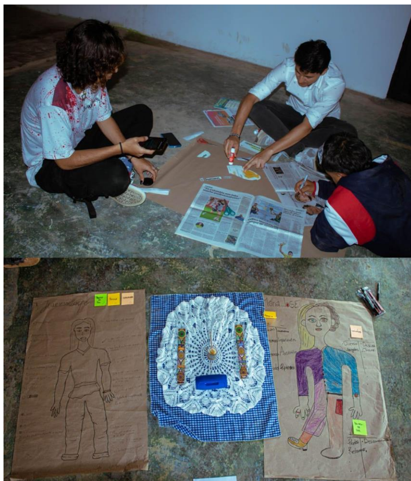
Imagen 5. Actividad: Mi cuerpo como cartografía

Uno de los planteamientos que surgió a partir de las reflexiones grupales y que tuvo mayor relevancia a lo largo de la investigación fue: “Debemos trabajar colaborativamente en medio de las diferencias”. En este sentido, el grupo de participantes coincidió en que solo las acciones que congregan un pluralismo de pensamientos, voces y significaciones, son las que arrojan resultados efectivos pues son producto del respeto y la valoración de las diversidades, la inclusión y los saberes divergentes. Lo anterior, se convierte en el principio de la cohesión social en un territorio transversalizado por los contrastes, como es el caso de Dabeiba.