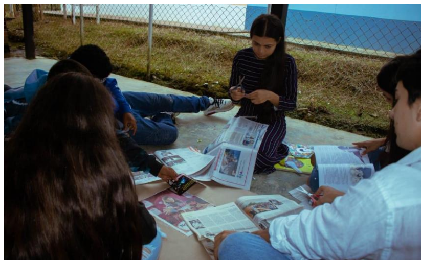
Imagen 8. Taller educomunicativo: el póster.

A propósito de lo anterior, los procesos de perdón y reconciliación siguen teniendo retos en cuanto a los resultados efectivos para la construcción de paces en Dabeiba. Por un lado, como consecuencia de la manera en que se han dispuesto los escenarios para el perdón y la reconciliación entre comunidades (eventos, capacitaciones y reuniones), que ignoran las dinámicas sociales, las lógicas territoriales y se convierten en actos protocolarios que no suscitan intereses, como lo ha expuesto el grupo de participantes. Por otro lado, debido a que el perdón y la reconciliación se han convertido en indicadores para demostrar y medir el compromiso de las comunidades y las organizaciones competentes con la construcción de paces, mas no son procesos de reflexión conscientes y significativos (Derrida, 2012).