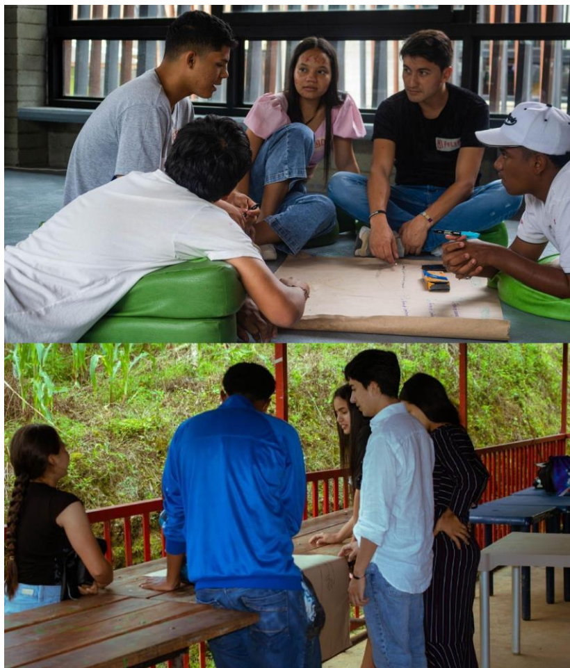
Imagen 2. Trabajo en equipo.

Más allá de los espacios declarados anteriormente (eventos, capacitaciones y reuniones), resulta evidente que los procesos comunicativos y de relacionamiento entre ambas comunidades son aún precarios o se encuentran en una fase incipiente de gestación.