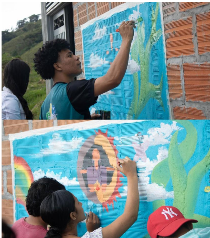
Imagen 4. Realización del “Mural de los sentimientos”.

A su vez, las expresiones y prácticas artísticas se adoptaron, a lo largo de los grupos focales, como mecanismos para la catarsis, la liberación de emociones y sentimientos, el autorreconocimiento y la sanación. Para las y los participantes, realizar este tipo de acciones favoreció la interacción entre ellos y la cohesión del grupo en la medida en que podían disfrutar del proceso y les permitió otras alternativas para la reflexión y la superación de los recuerdos traumáticos del pasado, así como para el relacionamiento con esos “otros mundos” que habitan un mismo territorio.